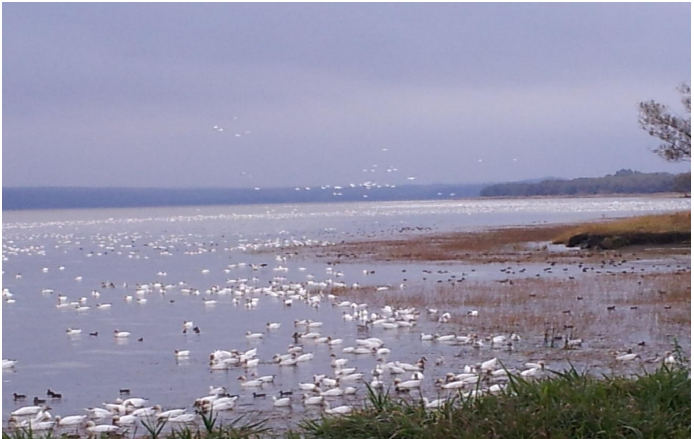
OIES BLANCHES ET SARCELLES D'HIVER

Puis, nous nous déplaçons vers les battures où la marée montante rassemble les oies et autres sauvagines tout près du site d'observation. Elles sont là par milliers, juste sous notre nez, à fouiller la vase et à se reposer en se laissant bercer par les flots la tête bien enfouie sous l'aile :