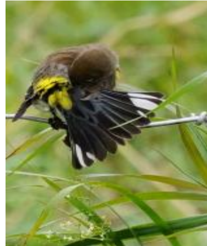
PARULINE À CROUPION JAUNE

Si la dégustation est plaisante, la déception est grande car les sentiers de marche sont fermés à cause de la chasse. Heureusement, des Bruants à gorge blanche et des Bruants chanteurs sont au rendez-vous et une Paruline à croupion jaune en plumage d'hiver nous donne un spectacle de toilette pendant une bonne dizaine de minutes, se contorsionnant pour nous exposer ses recoins les plus secrets. Vraiment une très belle observation!