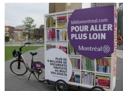
Le Biblio-bixi en tournée à Montréal

Plusieurs nouveautés se sont ajoutées dans la programmation des bibliothèques. C'est le cas du projet interculturel Jeux de Mots. En partenariat avec le ministère de l'Immigration et des Communautés culturelles et deux commissions scolaires, Jeux de Mots propose des ateliers pour les enfants francophones et allophones. Il vise à favoriser l'intégration et la francisation des jeunes Montréalais.