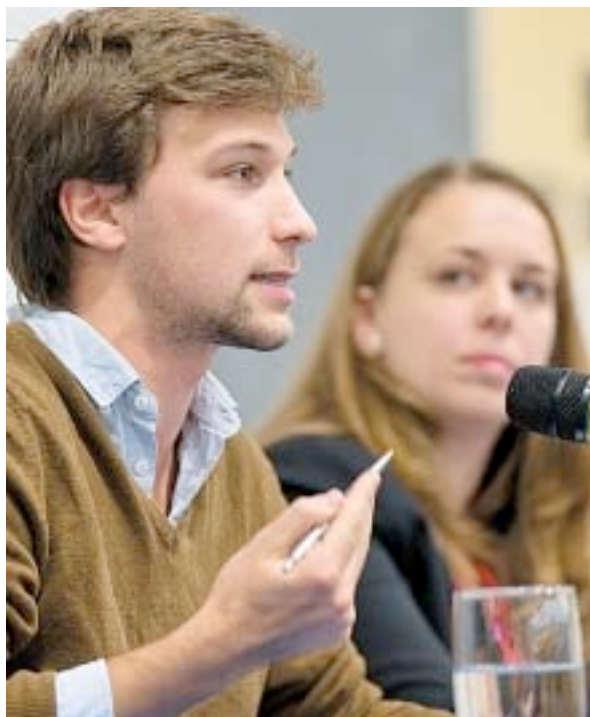
Fig. 1. La force de la jeunesse... La génération montante exige... En viendra-t’elle à exiger l’affirmation politique et financière du français, langue officielle du savoir dans l’Université québécoise?

“En fait, ils ont été invités à répondre à une chronique de Pierre Foglia de juin dernier, dans laquelle il y va d’un coup de gueule envers un père qui demande à la prof de français de son cégepien de fils pourquoi elle lui fait lire du Molière s’il est pour devenir ingénieur.”