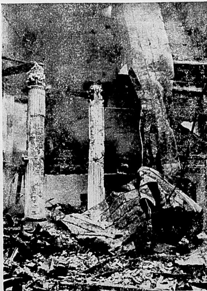
LES RUINES D'UNE UNIVERSITÉ.—Soixante pour cent des maisons d'enseignement ont été détruites, et 14,500,000 livres, répartis entre 350 bibliothèques, ont été perdus. Ces ruines d'une université défilent la générosité des étudiants Canadiens.

Aussi un documentaire sur l'île de Ceylon, une courte comédie de Charlie Chaplin et "LA 2E2", court métrage.