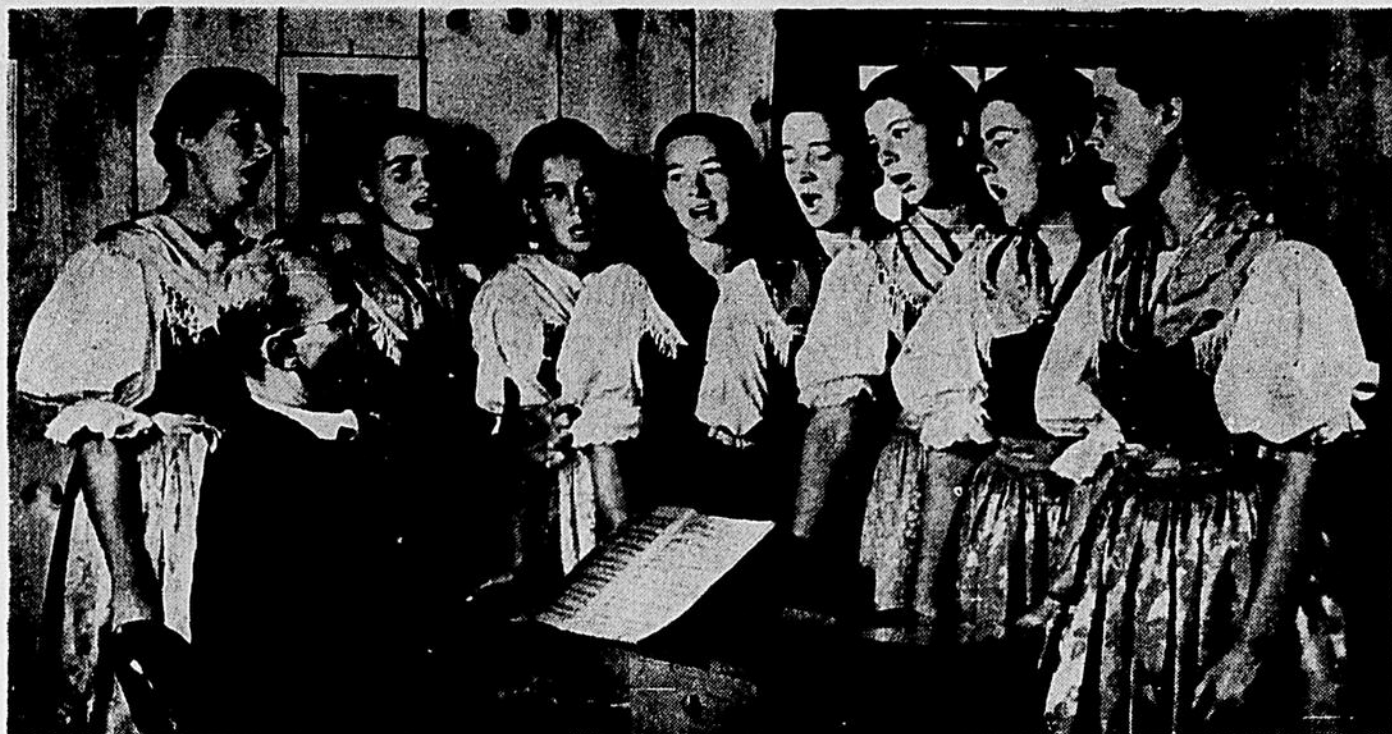
LA FAMILLE VON TRAPP, que l'on entendra à l'Auditorium de l'Université de Montréal, le samedi, 10 avril, à 8.30 heures. Billets: $1.25 et $1.00 à l'A.G.E.U.M., D'219. Tél.: EX. 1573.