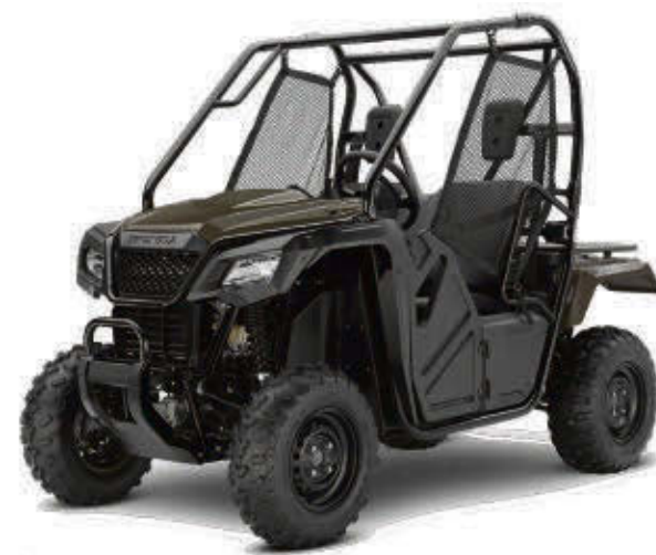
PIONEER 500 SXS500M2L 2020

Les offres s'appliquent aux contrats de vente au détail admissibles qui respectent le montant minimum applicable pour le financement de Honda de 3 000 $, pendant une durée limitée, jusqu'à épuisement des stocks. Offres valables sur certains modèles de VTT et véhicules côte à côte Honda neufs (jamais immatriculés auparavant) achetés entre le 1er janvier 2020 et le 31 mars 2020 auprès d'un concessionnaire Honda agréé participant au Canada. Offre de financement à durée limitée offerte par l'entremise de Services Financiers Honda Inc., sur approbation de crédit. *Financement à partir de 2,9 % jusqu'à 24 mois sur modèles sélectionnés. Les modèles, les couleurs, les caractéristiques et les spécifications peuvent différer légèrement de leur illustration. Sauf erreur ou omission. Offre prend fin le 31 mars 2020.