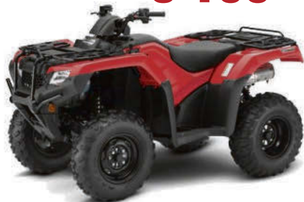
RANCHER TRX 420 FM1L 2020