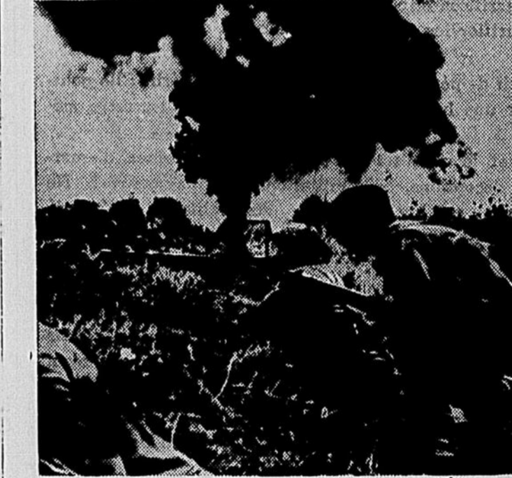
Photo prise le 24 octobre, pendant la bataille d'Hertoegenbosch. Les troupes britanniques ont rencontré une vive résistance aux abords de St. Michielsgestel, localité au sud-est d'Hertoegenbosch. Au troisième assaut, un certain nombre de soldats allemands furent faits prisonniers.