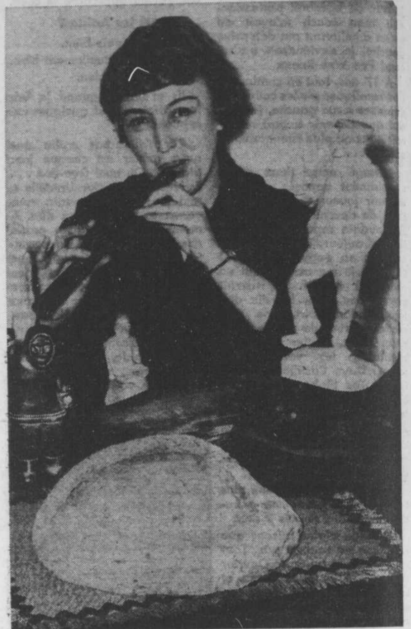
La vie sourit aux audacieuses

—Pas du tout. J'y ai paru à quelques reprises. La semaine dernière, Maurice Dubois, le réalisateur m'avait invitée pour le Club des Autographes. Mais je joue de malchance, la télémission ayant dû être contremandée, comme vous le savez. Quoi qu'il en soit, j'accepte ce qu'on m'offre à la TV. Au Québec, où les boîtes de chansonniers sont pratique-