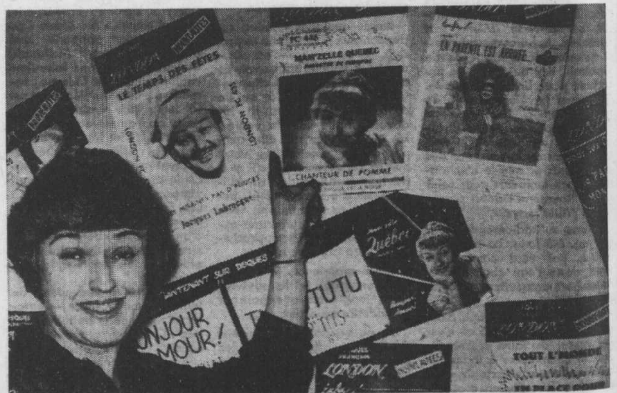
La publicité, c'est bon. La bonne, surtout!