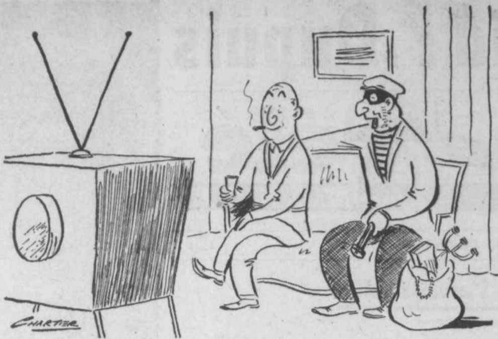
—Un bon gag, ce serait de voler chez les réalisateurs... pendant qu'ils sont dehors!

Cela nous promet une belle série de films de haute tenue, si l'on en juge par