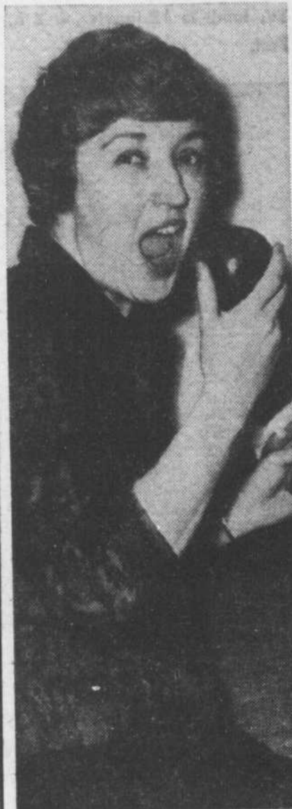
Une pomme par jour... keeps the doctor away.

—Pourquoi pas? Il y a au Canada français, de bons compositeurs, de bons paroliers, et je ne demande pas mieux que de chanter leurs chansons. D'ailleurs le public, de plus en plus, les apprécie, quand elles sont bien faites.