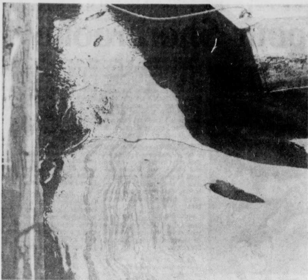
Que penser de cette nappe d'huile sur la rivière Magog?