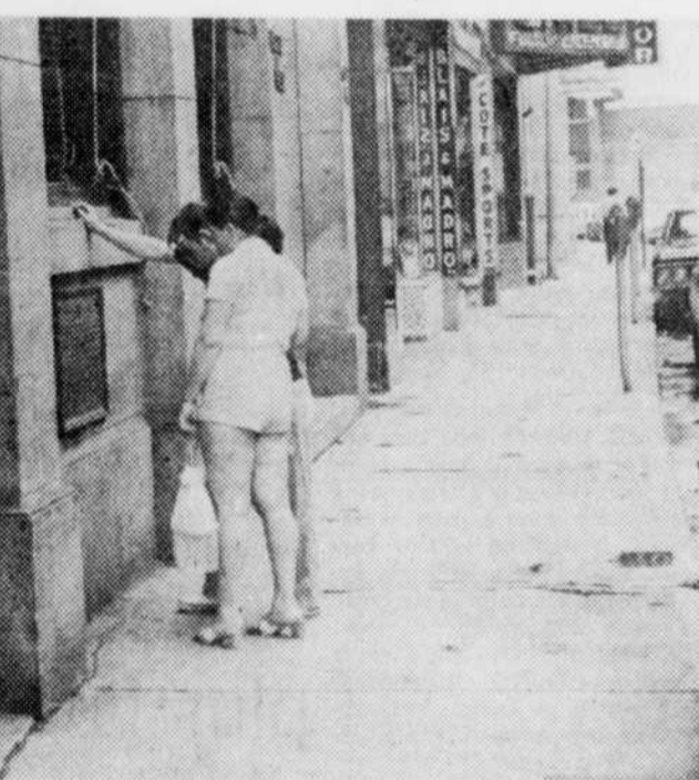
GRAND CALME — Un grand calme régnait rue Wellington, hier, jour de la Confédération. Au nombre des passants, quelques touristes attirés par le côté historique de Sherbrooke.

Au terminus d'autobus, les autorités ont noté une certaine augmentation de voyageurs. Les autorités ont également remarqué plusieurs personnes en provenance des Etats-Unis, de Montréal et Québec. Un autre groupe d'étudiants est arrivé par autobus en provenance du Manitoba pour des échanges d'étudiants avec Sherbrooke.