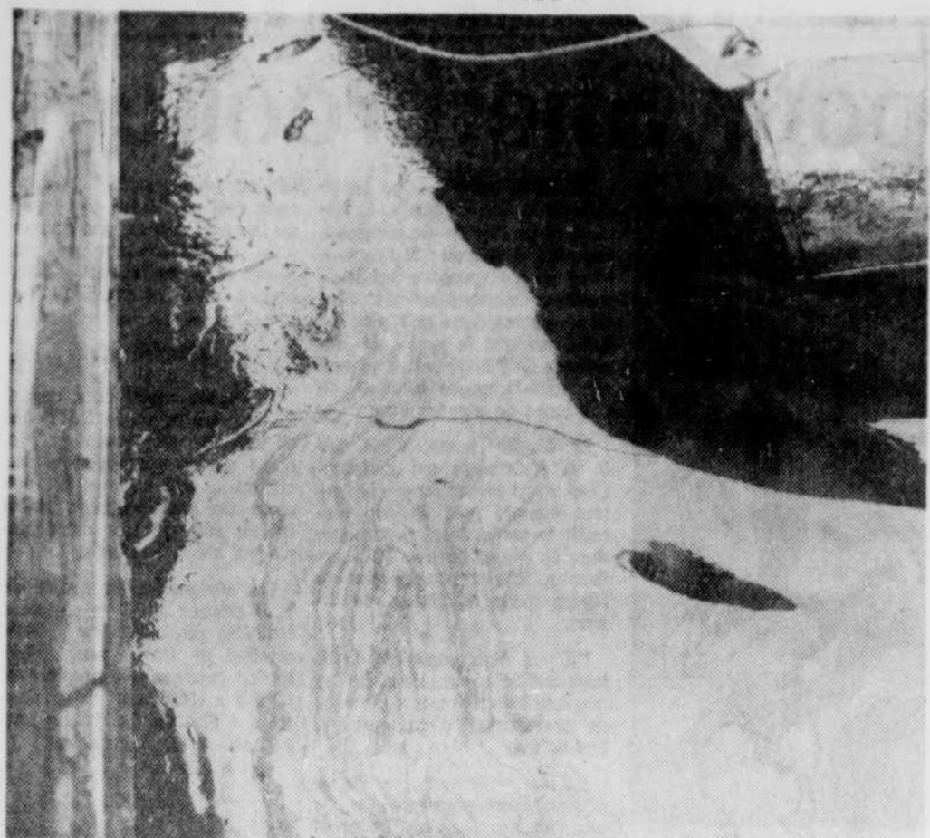
Que penser de cette nappe d'huile sur la rivière Magog?