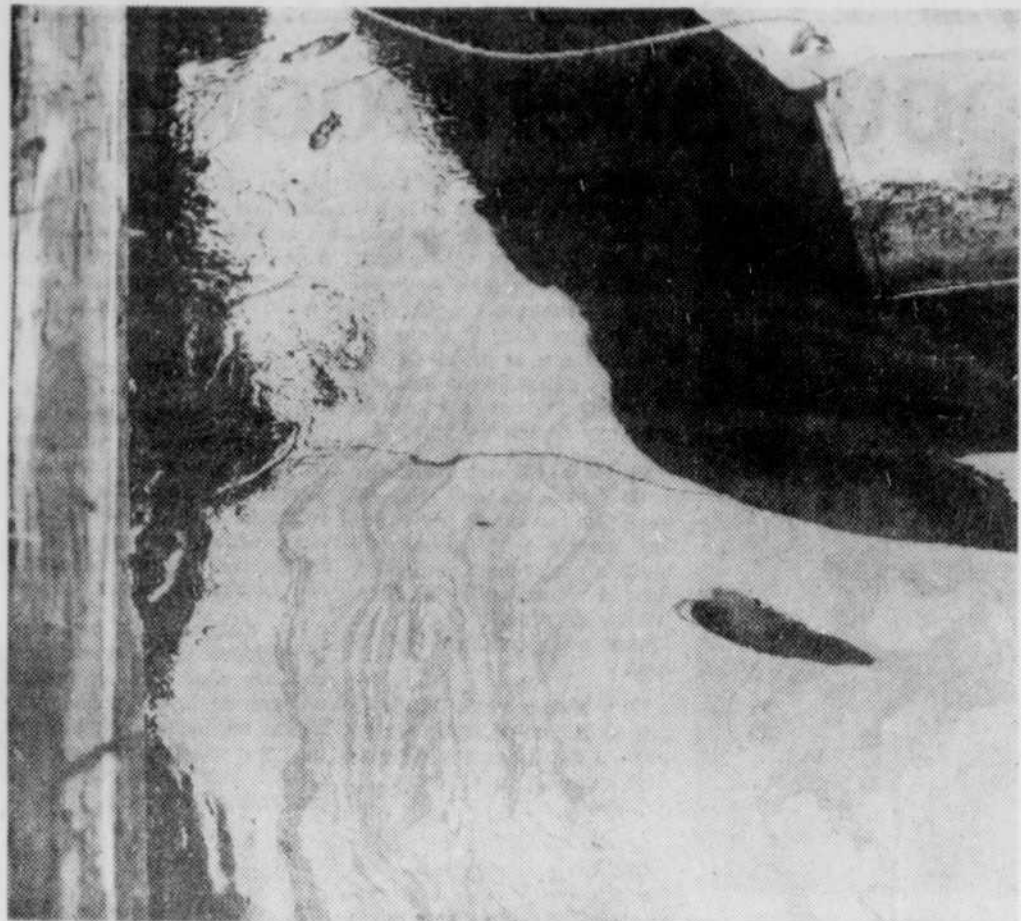
Que penser de cette nappe d'huile sur la rivière Magog?