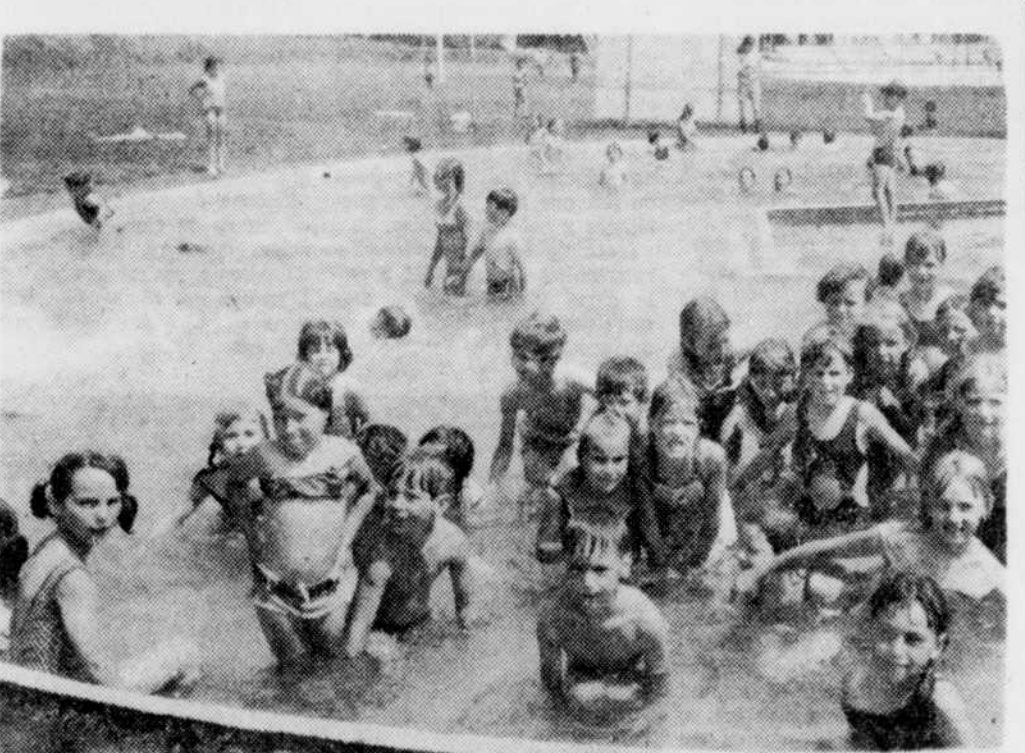
La piscine pour les enfants de dix ans et moins vient d'ouvrir au parc Nicol à East Angus et tous les parents sont invités à envoyer sans crainte leurs enfants s'amuser. Cette piscine est sous la surveillance de Mme Gertrude Boucher. Les règlements seront annoncés plus tard.