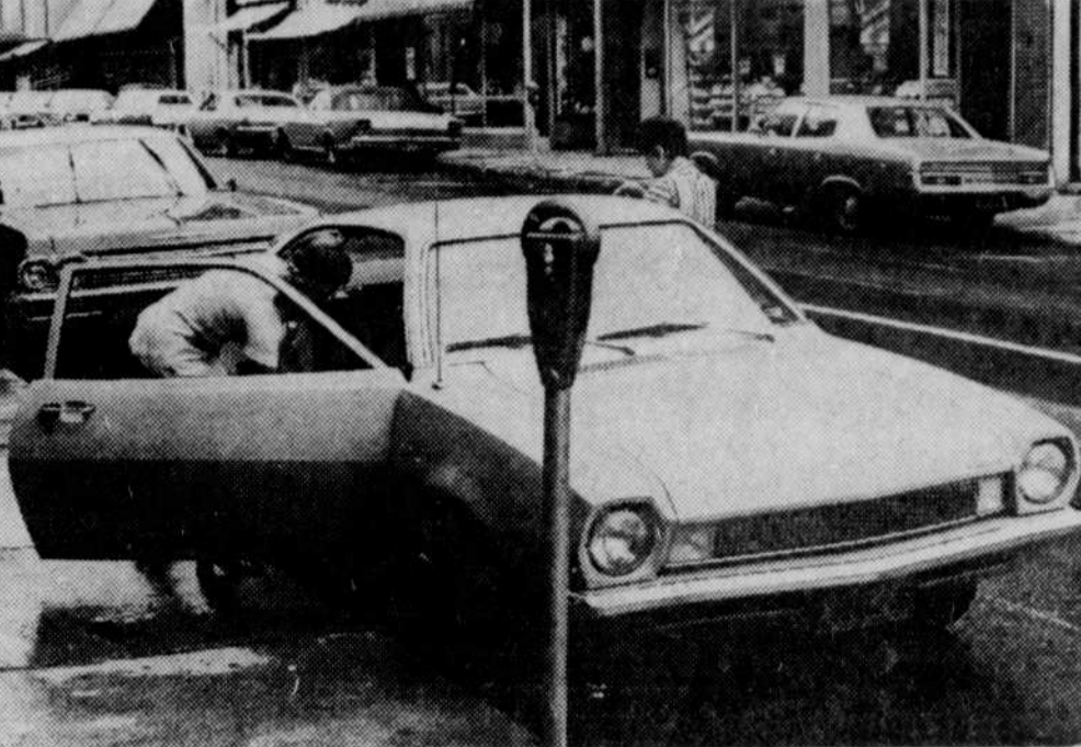
UN PETIT CADEAU — A cause de la fête d'hier, les automobilistes n'ont pas été obligés de déposer de la monnaie dans les parcomètres.

SHERBROOKE — C'est à compter d'hier que certains hôpitaux de la région et tous les hôpitaux de Sherbrooke ont appliqué les nouvelles heures de visite, uniformes pour toutes les institutions hospitalières concernées. Sur semaine, les visites aux patients sont autorisées de 7 heures à 9 heures, en soirée, pour deux visiteurs à la fois seulement pour chaque patient. Les visiteurs ne sont donc plus admis auprès des malades, au cours de l'après-midi. En fin de semaine, soit le samedi et le dimanche, de même que les jours fériés, soit le Nouvel An, la St-Jean-Baptiste, la Confédération, Noël, les visiteurs seront autorisés à visiter les malades durant l'après-midi, de 2 heures à 4 heures, et le soir, de 7 heures à 9 heures, pour deux visiteurs à la fois pour chaque patient. Ce règlement ne sera toutefois pas appliqué pour les pédiatres, où chaque hôpital émet sa propre directive. Des autorisations spéciales se-