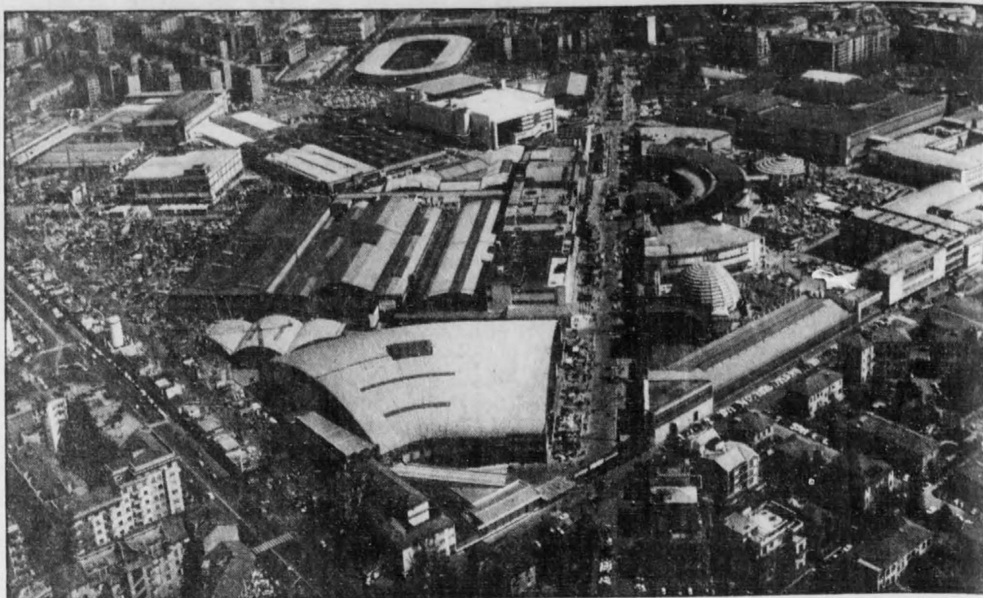
Milan, « une ville aimable pourvu qu'on y connaisse quelqu'un... ».

sur des bancs ou à la gare. Mieux vaut un placard qu'un banc... surtout avec la sérénade.