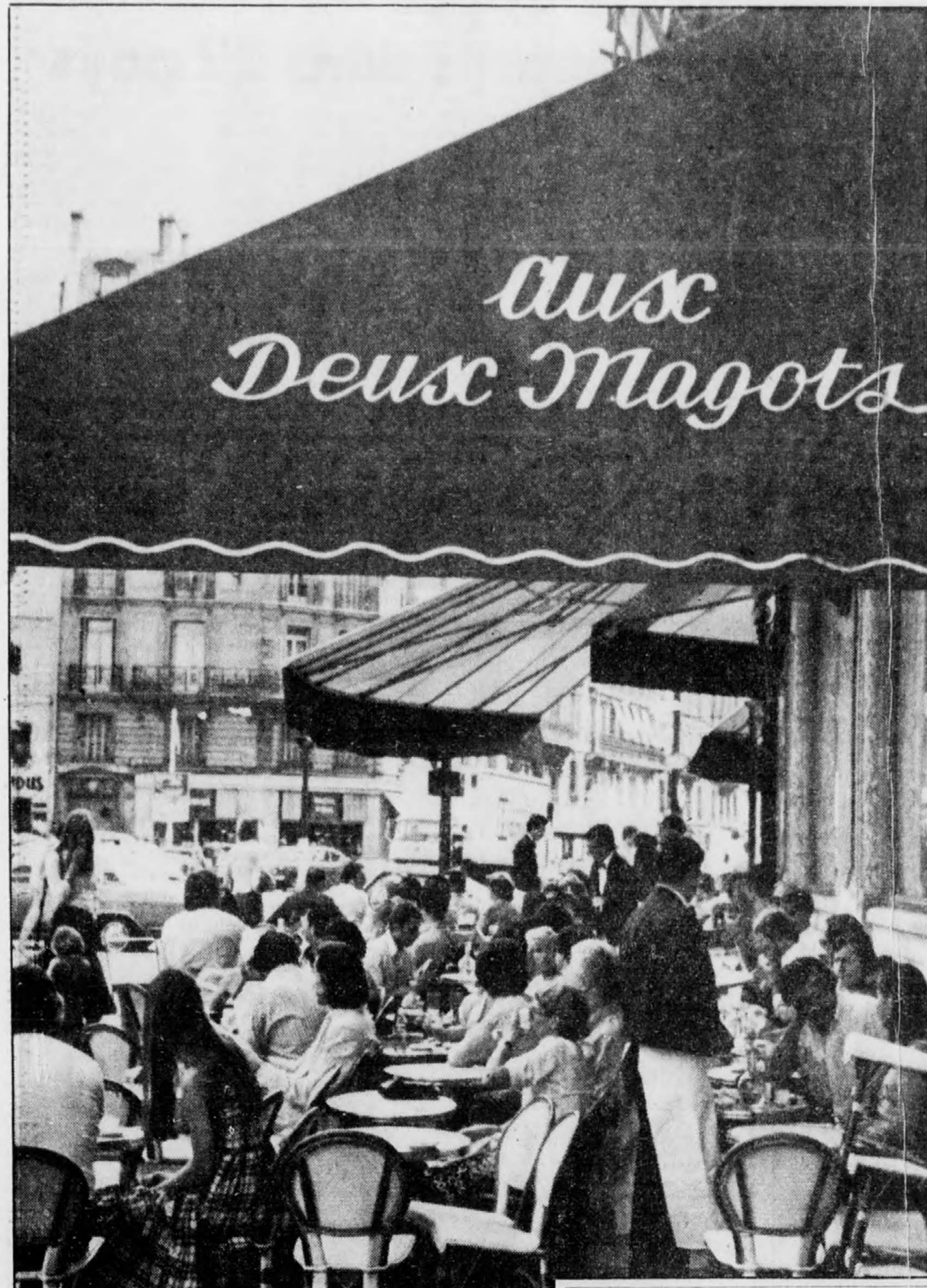
De jour, la communication ordinaire s'établit bien quand on peut se voir dans le blanc des yeux, mais si elle se prolonge pour devenir extraordinaire...

Et finalement, le conseil que la majorité des voyageuses suivent maintenant, quand le goût de partir est trop fort et qu'il ne se trouve personne de disponible pour les accompagner: se joindre à un groupe. On a dit beaucoup de mal des voyages de groupe. On en dit aussi beaucoup de bien. S'ils ne représentent pas la Grande Aventure, ils ont plusieurs avantages, dont celui d'être sécuritaires et d'enlever tout souci du quotidien immédiat: organisation de bagages, de repas, d'itinéraires. Et toute personne qui a un peu d'imagination et qui sait regarder en fait bien ce qu'elle veut. Il est rare d'ailleurs qu'il ne se trouve pas au moins une personne dans ce genre de voyages avec qui on ne puisse échanger impressions ou expériences. Et, en cas de maladies, blessures ou accidents, il est toujours bon de connaître quelqu'un.