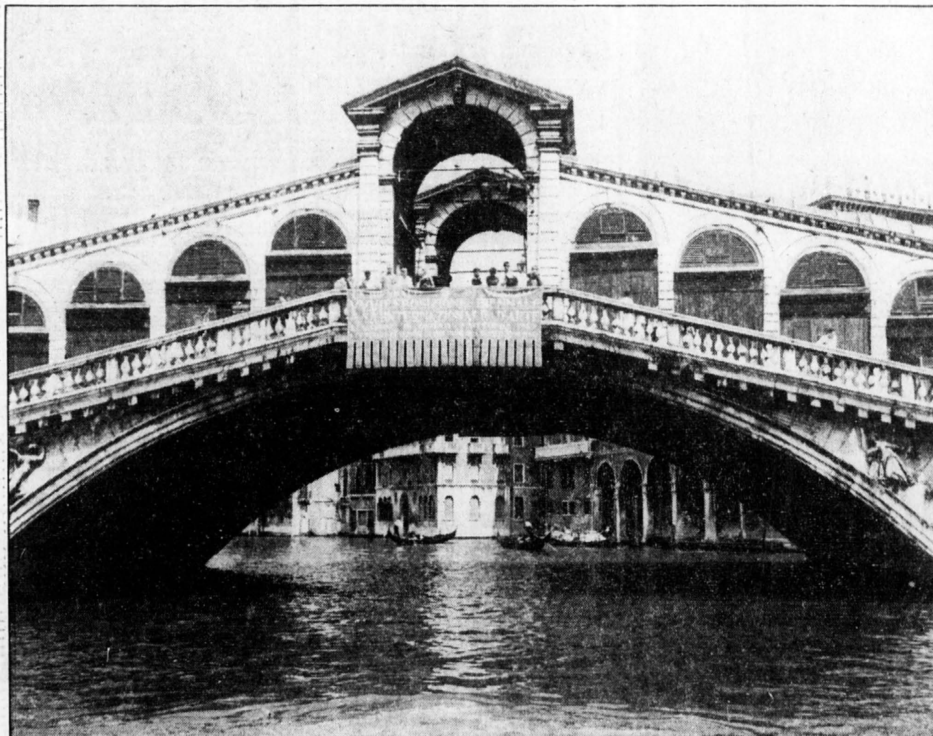
Le pont Rialto à Venise