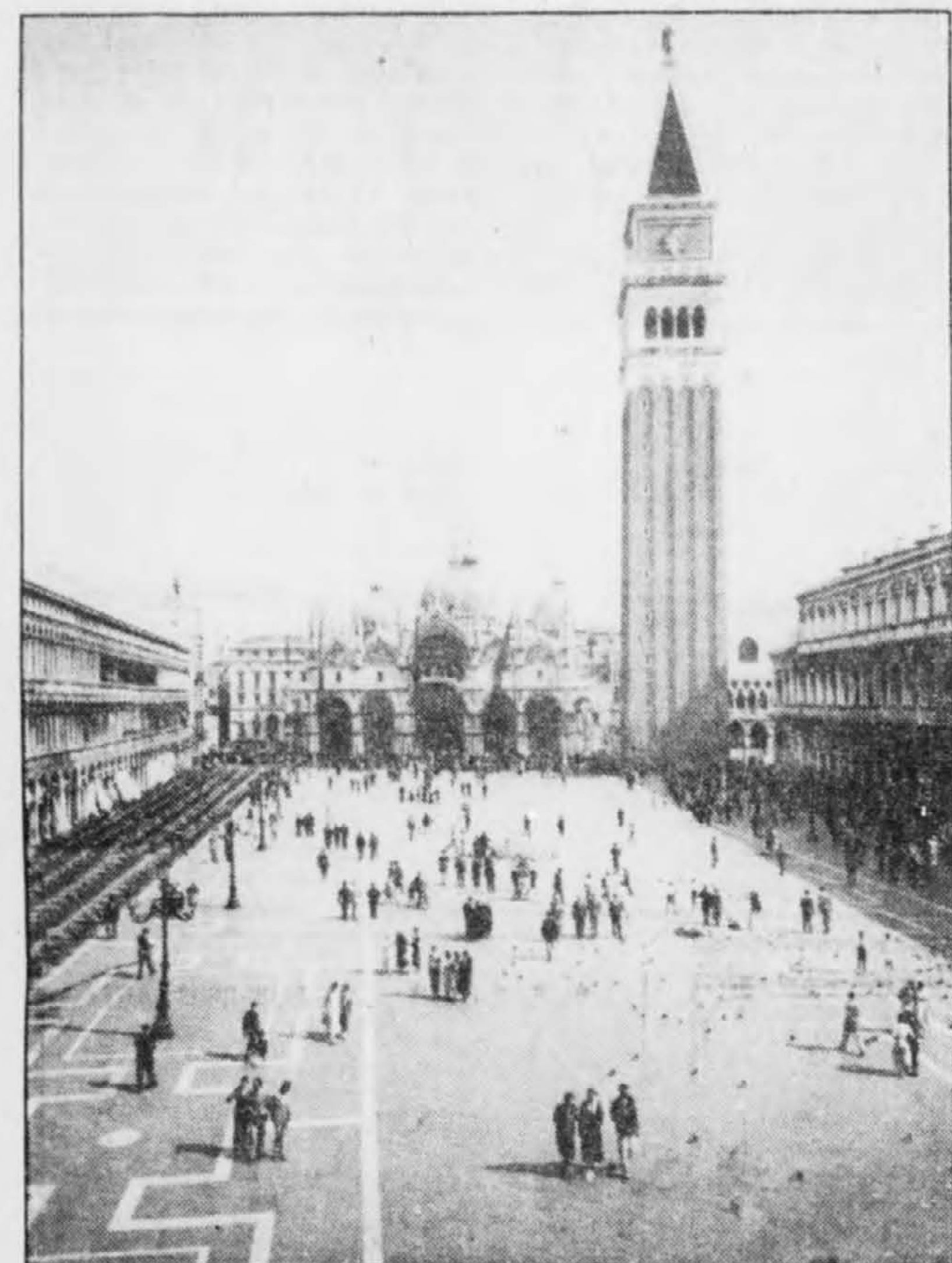
La Place Saint-Marc à Venise.

Venise, c'est une ville miracle et la voir venir vers soi, dans la lumière grisée d'une fin de journée, c'est se laisser conquérir d'emblée. Un Venitien à la voix de baryton et aux beaux bras forts chante O Sole mio, alors que je défais pour la nième fois mon sac de voyage dans la chambre à coucher, genre placard, qu'on m'a dévolue dans le petit hôtel qui nous abrite, mes compagnons de voyage et moi. Le chanteur me réconcilie avec la petitesse des lieux. Des milliers de touristes, m'a dit le préposé à la réception alors que je rouspetais un peu, coucheront ce soir dehors