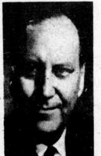
AZ ELLUS DENIS: 56 ans, (Montréal-St-Denis) Ministre des Postes.