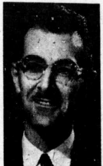
JEAN - PAUL DESCHATELETS: 50 ans. Député de Montréal, Maisonneuve-Rosemont, Ministre des Travaux Publics.