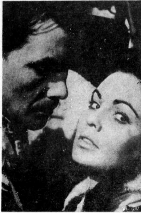
« Fille des steppes »