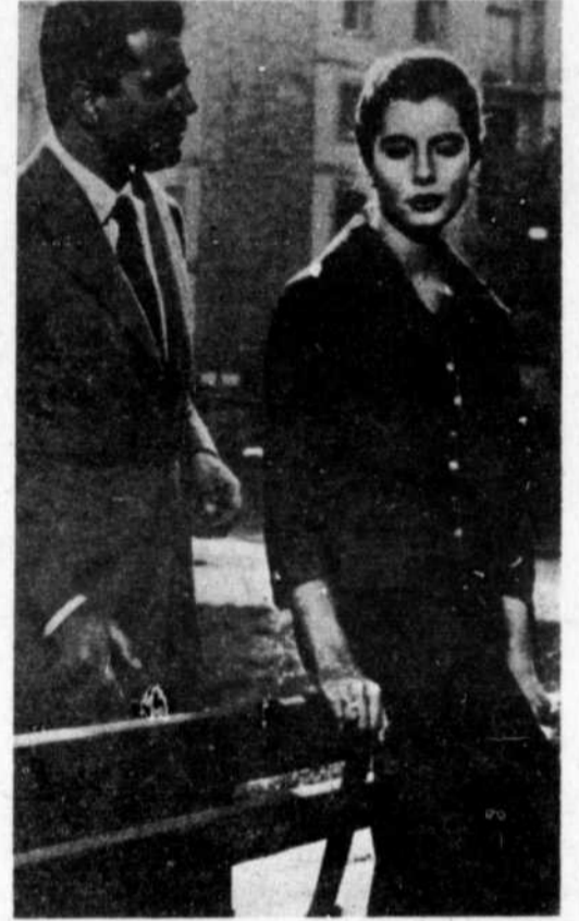
« Les Epoux terribles »

Maintenant que la saison de hockey est terminée, Radio-Canada met à l'affiche du réseau français de télévision une longue série très appréciée des amateurs de bons films, Billet de faveur, qui passera tous les samedis à 8h. 30 du soir.