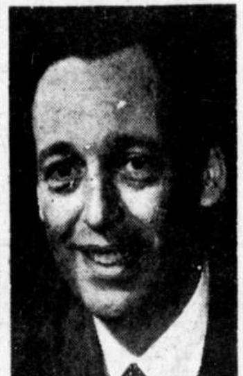
MAURICE LAMONTAGNE: 46 ans. Député de Montréal-Ouaremont - St-Jean, Président du Conseil Privé.