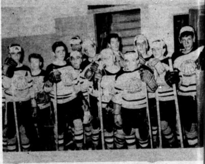
L'Equipe Bantam de Tétreaultville.