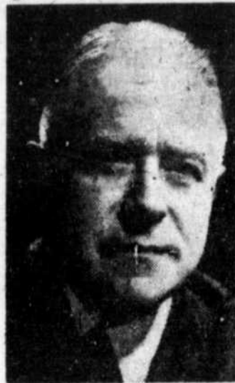
LIONEL CHEVRIER: 60 ans, député de Montréal-Laurier, réélu le 8 avril. Ministre de la Justice et premier-ministre suppléant.