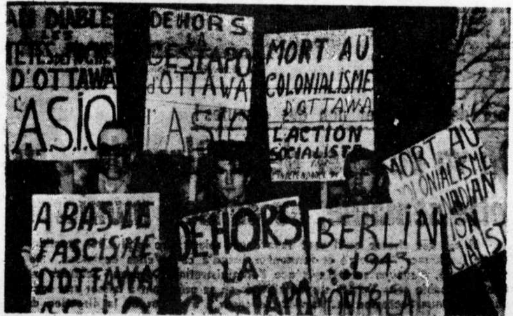
Voici un groupe des quelques 200 manifestants qui ont manifesté samedi dernier devant le quartier-général de la Gendarmerie Royale.