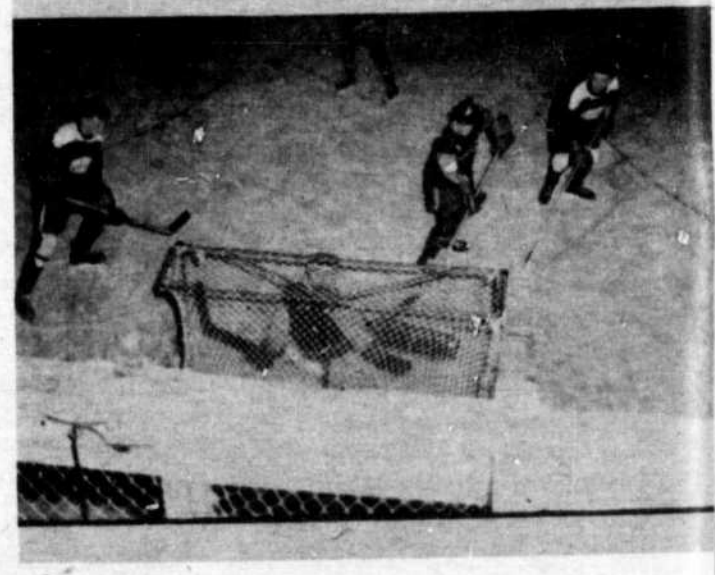
Club St-Joseph du Wrightville -vs- Montebello.