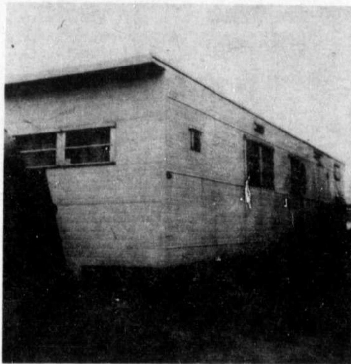
La roulotte de l'Hydro-Québec qui était stationnée à Masson pendant la période des travaux qu'ils ont exécutés dans cette localité, quittera bientôt les lieux.