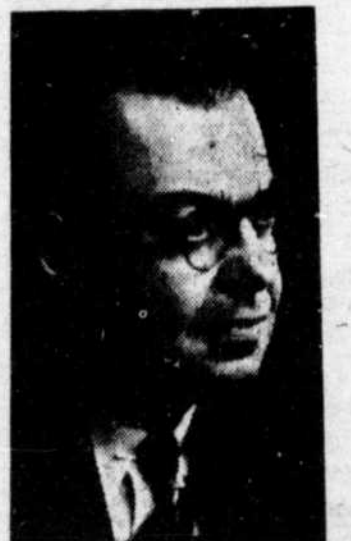
PAUL MARTIN, 59 ans, député d'Essex-Est, (Ontario). Ministre des affaires extérieures.