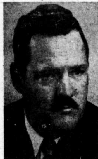
GUY FAVREAU: 46 ans. Député de Montréal-Papineau. Ministre de la Citoyenneté et de l'Immigration.