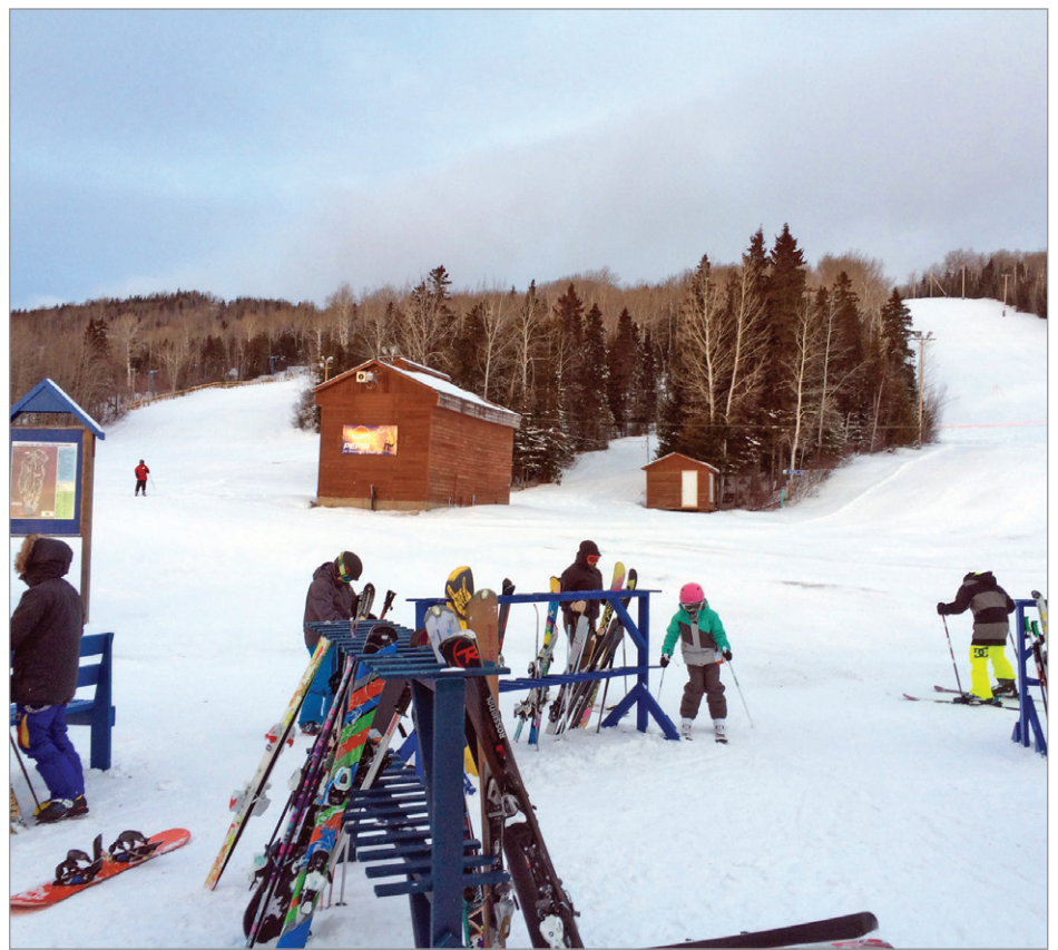
Le mont Bechervaise connaît un début de saison remarquable.

Le directeur souligne également son bonheur d'être venu à Bechervaise : « cette année, pour l'instant, on a eu les plus belles conditions de ski au Québec. C'est une vraie carte postale, quand on est en haut de la montagne. On ne peut pas s'imaginer que c'est si beau que ça », a-t-il conclu.