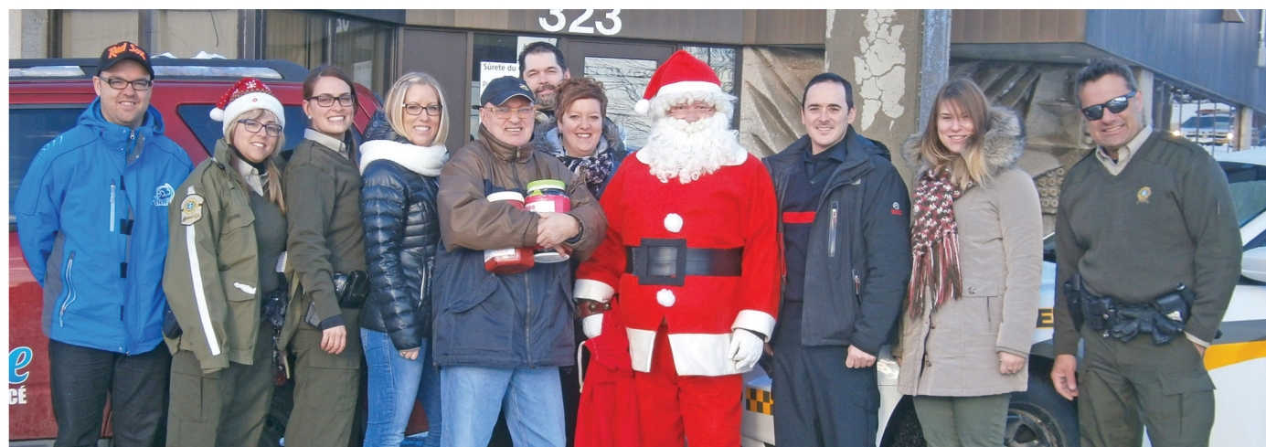
Voici toute cette belle équipe à la base de la guignolée 2014 au Centre d'action bénévole Gascons-Percé.

en plus difficile pour les familles à faible revenu de joindre les deux bouts. La banque alimentaire du Centre d'Action Bénévole Gascons-Percé inc. répond à des demandes d'aide alimentaire d'urgence durant la période des Fêtes et pour les mois rudes qui suivent grâce à la générosité et au soutien de la population et de Centraide Gaspésie/Îles-de-la-