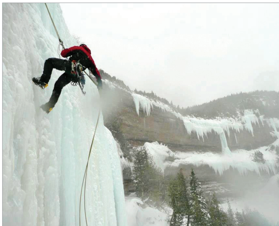
L'escalade de glace est en plein essor dans la région.

Le regroupement est présent sur Facebook, pour les intéressés.