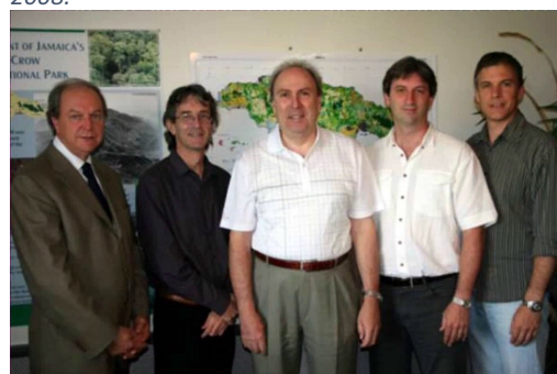
Figure 15 : Les artisans du prix « Un arbre à aimer », en 2008.