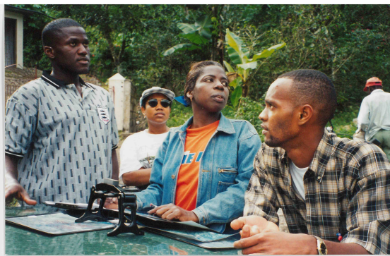
Figure 14 : Formation en photo-interprétation en Jamaïque en 1998.

Au sortir de cette décennie, toutes les firmes de l'Ouest canadien actives en foresterie sur les marchés internationaux ont été rayées de la carte. La seule qui survivait, Reid Collins, en partenariat avec TecSult en Jamaïque, est acquise en 1999 par une firme américaine du nom d'ORM (Olympic Resource Management) qui ne s'intéresse qu'à des projets financés par le privé. TecSult complètera seul ce projet.