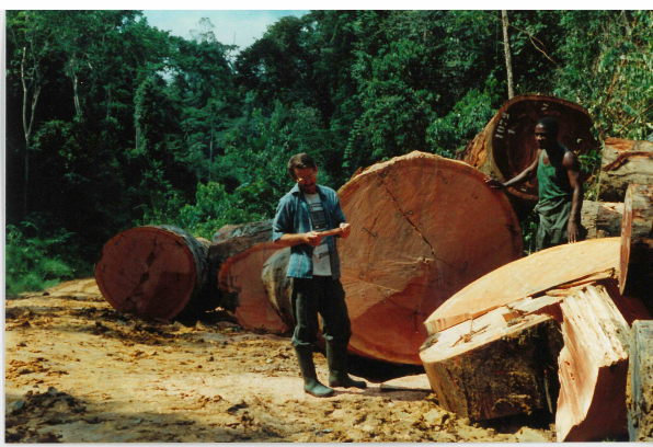
Figure 11 : Exploitation forestière au Gabon en 1999.