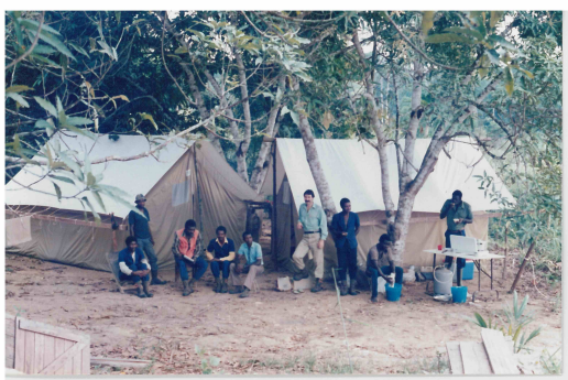
Figure 8 : Travaux d'inventaires au Cameroun en 1985-1987.