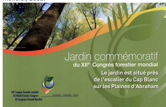
Figure 1 : Jardin commémoratif du XII e Congrès forestier mondial, 2003.