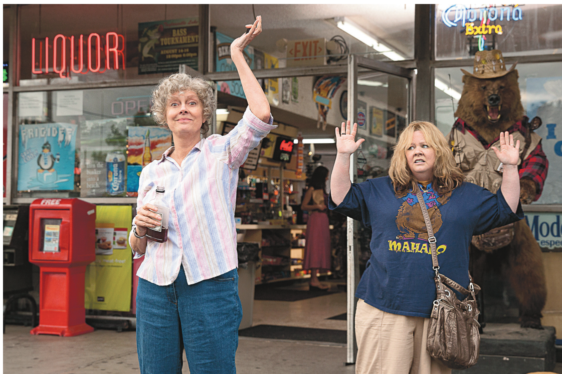
Tammy (à droite) et sa grand-mère vivent une suite de péripéties rocambolesques dans un film à deux vitesses, où la sentimentalité plombe les meilleures intentions.

Sa couronne est toutefois tachée d'huile à moteur et à friture, car elle réussit à perdre, le