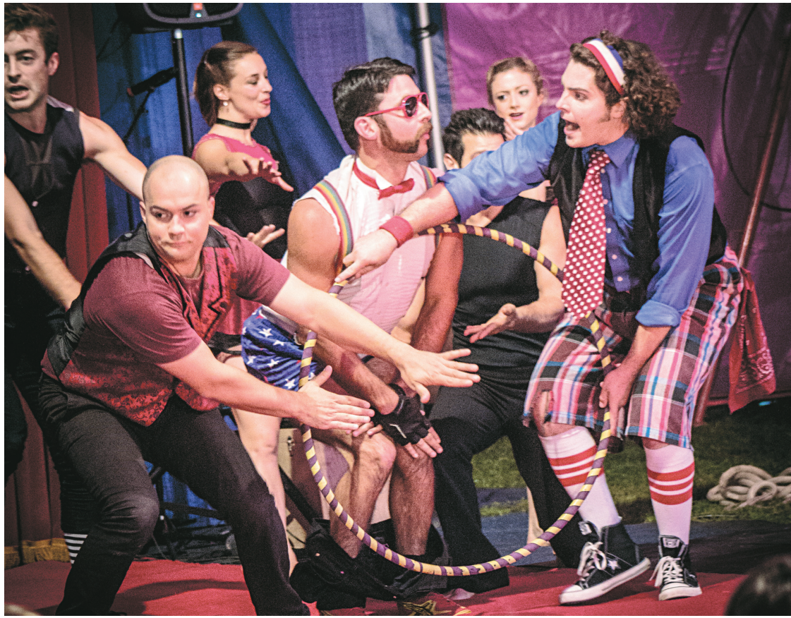
Small Tent, Big Shoulders, spectacle de la troupe américaine Midnight Circus qui sera présenté en avant-première, constitue sans doute le meilleur exemple de production « pour tous ».

Cela étant dit, il n'est absolument pas question pour