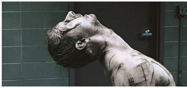
Le film comprend une scène d'exorcisme des plus ridicules.

Scott Derrickson, le réalisateur de Délivrez-nous du mal , a tâté autrefois la possession démoniaque dans L'exorcisme d'Emily Rose (2005), plus réussi, et plus ambigu (et également «basé sur des faits vécus»). Cela dit, son plus récent film lorgne davantage du côté du méconnu L'exorciste III (1990), de William Peter Blatty, qui fusionna autrefois les deux genres en question