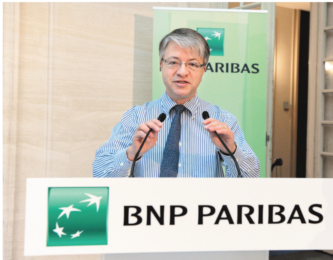
Jean-Laurent Bonnafé, directeur général de la banque BNP Paribas.

Le régulateur bancaire français avait déjà tenu à rassurer sitôt l'ampleur des sanctions connue. L'Autorité de contrôle prudentiel et de résolution avait jugé dès lundi soir que BNP Paribas était capable d'absorber les conséquences anticipées de la punition. Le directeur général, Jean-Laurent Bonnafé, a enfoncé le clou mardi: «aucun client, ni aucun contribuable français ne sera mis à contribution. Cette sanction financière n'aura aucun impact sur nos tarifs, sur la sécurité financière de nos clients ou sur le service que nous leur apportons», a-t-il insisté auprès de l'AFP. Dans un message interne que s'est procuré l'AFP, il a, en outre, promis qu'il n'y aurait pas de conséquence sur l'emploi ou sur la politique de rémunération.