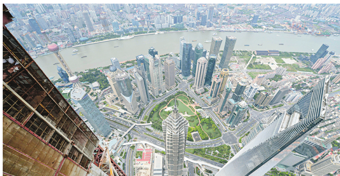
Vue sur Shanghai.

Prendre la température de ce fameux marché qui draine directement de 12% à 16% du PIB chinois n'est pas un exercice évident, surtout depuis que les statisticiens d'État ont cessé de publier une moyenne nationale depuis février 2011, jugée trop anxiogène et reflétant mal les disparités.