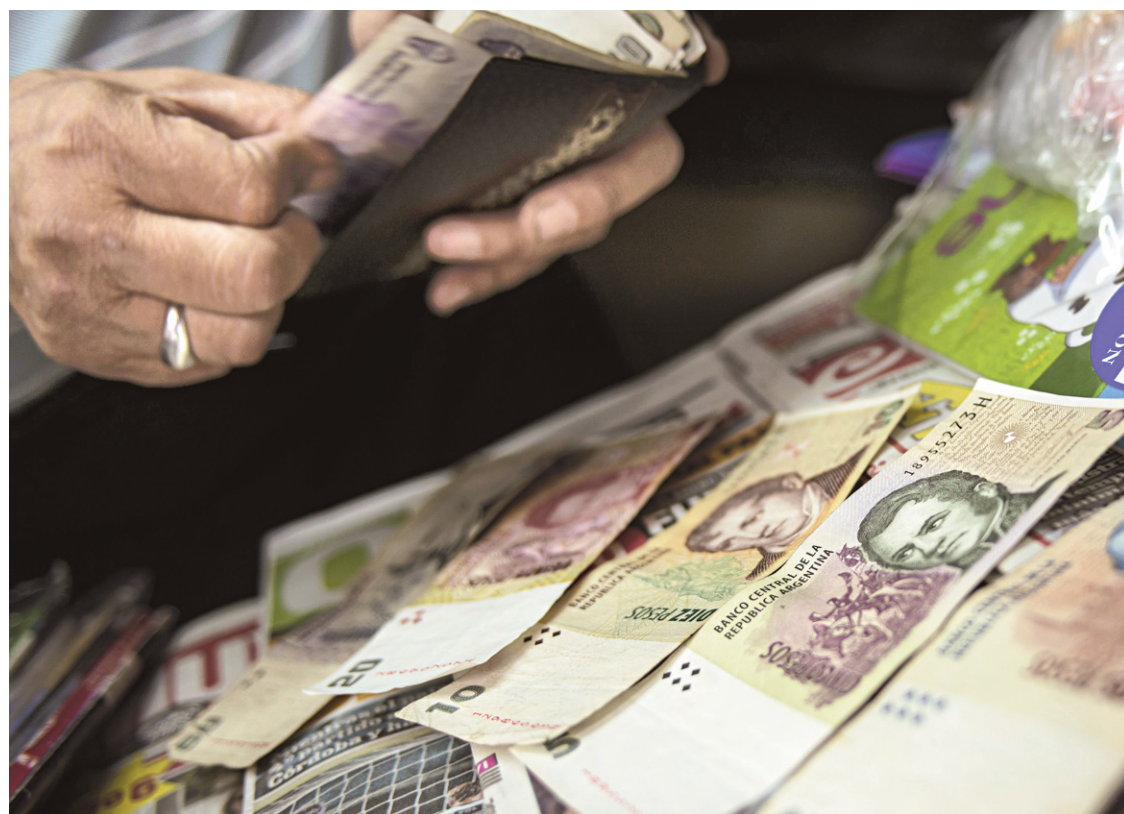
LEO LA VALLE AGENCE FRANCE-PRESSE

L'Argentine traîne les pieds pour s'acquitter des 1,3 milliard de dollars car elle redoute que ce règlement déclenche une avalanche de revendications de la part des autres fonds ayant refusé les restructurations de la dette argentine. Ce serait alors 15 milliards de dollars supplémentaires que devrait payer l'Argentine, un remboursement aussi important serait impossible à l'heure où la banque centrale d'Argentine ne dispose que de 28,5 milliards de réserves en dollars, sur fond de déficit énergétique et d'amorce de récession économique.