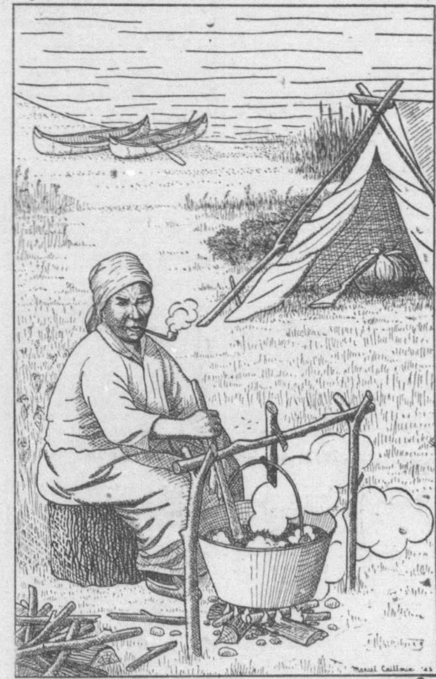
Mère Dubé préparant son fromage de bleuets.

Au travers de la cendre noire, animée d'une force ténue, aveugle et magnifique, une plante va son chemin, bientôt suivie d'une seconde, puis d'une troisième. C'est l'épiloche, l'herbe-à-feu, qui va, par légions serrées, envahir le brûlé, arborer ses longues quenouilles pourpres dont les fleurs, de courte durée, se reliaient pour assurer