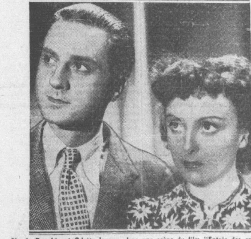
Claude Dauphin et Odette Joyeux, dans une scène du film "Entrée des artistes", aujourd'hui même au Saint-Denis.