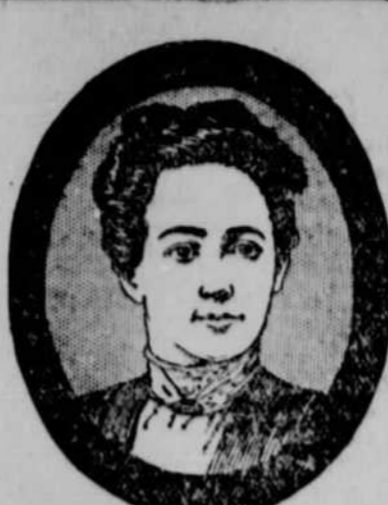
Cette femme dit que le Composé Végetal de Lydia E. Pinkham lui a sauvé la vie.

Trop cher. —Comment, docteur, vous me comptez vingt francs la visite ? —Mais c'est moins cher que partout le monde. —C'est vrai ; mais songez que c'est moi qui ai apporté la maladie dans le quartier !