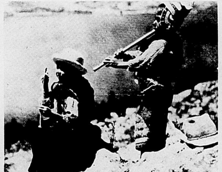
"l'image qu'on vous offre habituellement de la Bolivie"

sieurs villes du pays. Mais, fait sans précédent, les paysans qui ne sont guère polissés, et qui ont toujours manifesté de la sympathie envers le régime Banzer, se sont eux aussi révoltés contre les mesures du gouvernement. Les routes ont été bloquées, et la 2e ville du pays, Cochabamba, a été isolée pendant plusieurs heures. La réaction du gouvernement fut très dure. Dans les villes, les manifestations ont été réprimées avec violence. A la campagne, l'armée a dû intervenir. Le 30 janvier, les troupes avec l'appui de l'aviation, ont investi les foyers de résistance dans la région de Tolata; environ 100 paysans ont