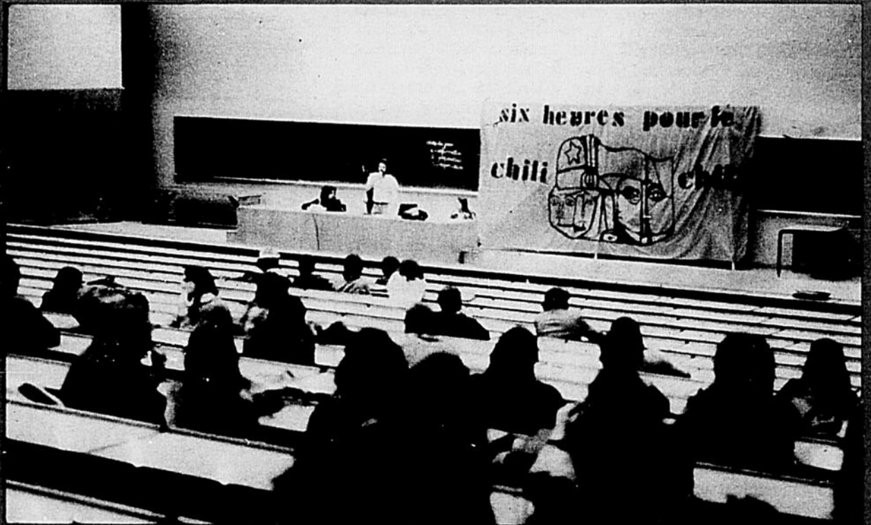
"C'est envers et contre tous les agents de sécurité que le Comité Québec-Chili a tenu les '6 heures-Chili' la semaine dernière..."

Face à cette tactique, quelles sont les réactions des étudiants? Cette fois-ci elles ont été très vives et très rapides. Les ventes se sont poursuivies de plus belle, il y a eu les six heures-chili, des affiches sur les murs, de la musique dans les couloirs, etc. L'administration n'avait pas le choix, elle a reculé temporairement. Mais elle l'a fait parce que les étudiants ont exercé concrètement ces droits qu'ils ne veulent pas perdre et qu'ils ont eu à chaque fois l'appui de tous ceux qui étaient présents, non pas parce qu'ils ont pris un vote contre ces mesures. En effet, face à ces tests que fait l'administration il est inutile de voter l'exigence du retrait d'un règlement qui n'existe pas encore; il est inutile également de s'apitoyer longuement sur notre sort de victimes de la ré-