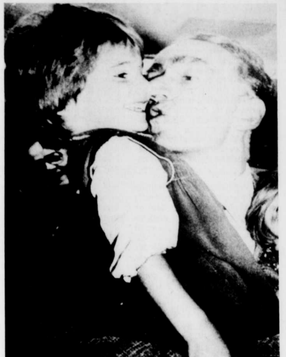
Le chef du Parti libéral, M. Claude Ryan, a rendu, sans se faire prier, son baiser à cette jeune admiratrice qui lui a sauté au cou alors qu'il faisait campagne dans la banlieue montréalaise.