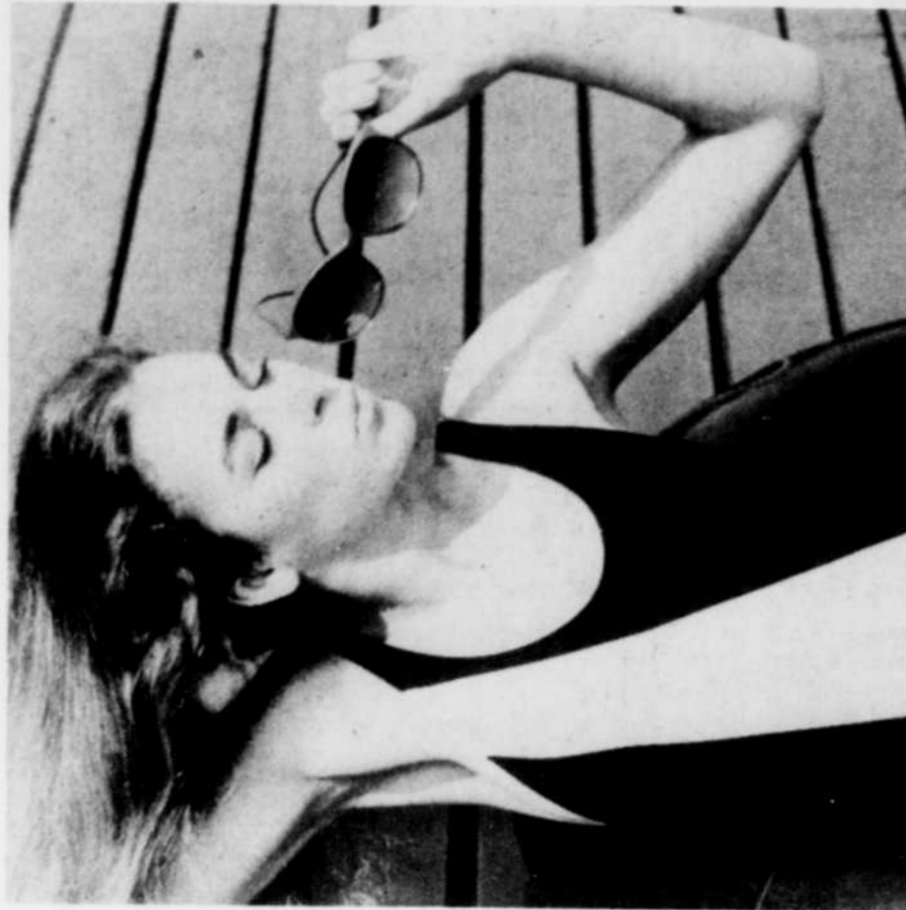
Pour bronzer sans danger, il faut savoir doser le temps d'exposition au soleil et protéger le corps avec une crème adaptée à la nature de son épiderme.

Il y a des peaux qui bronzent facilement et vite. Elles peuvent se contenter d'un gel solaire, contenant un filtre sélectif et assurant une protection assez faible.