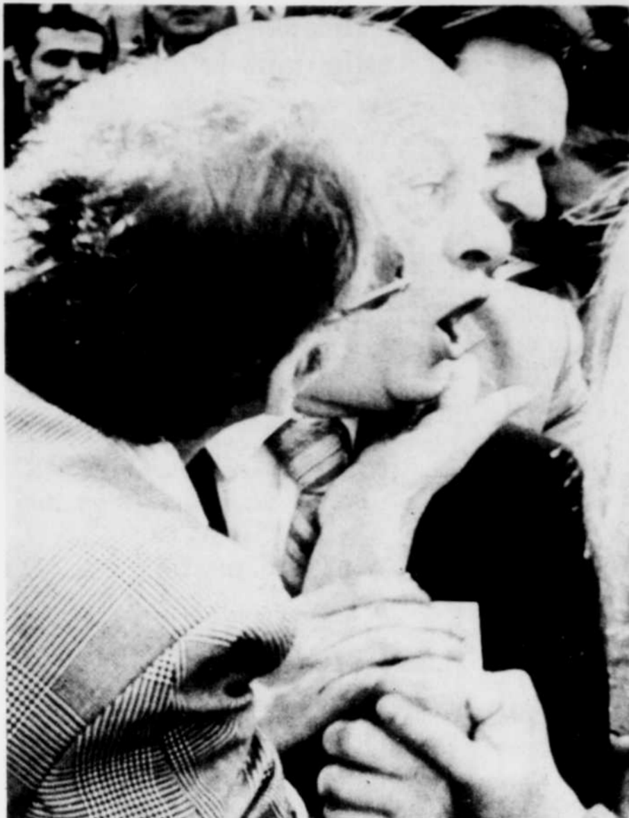
Le premier ministre du Québec, M. René Lévesque, a eu peine à réprimer un sursaut au moment où, dans un élan d'enthousiasme, un admirateur lui a donné une chaleureuse accolade.

Finance Informations générales Arts et divertissements