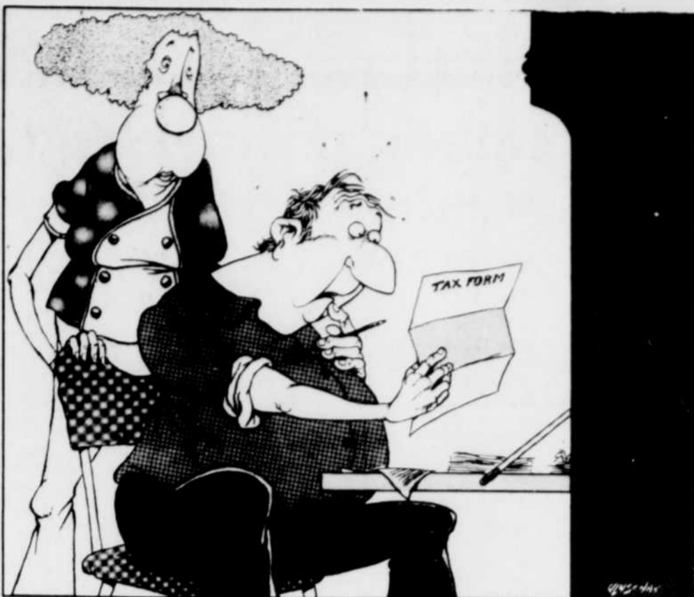
"Nom, adresse, statut civil, groupe sanguin..."