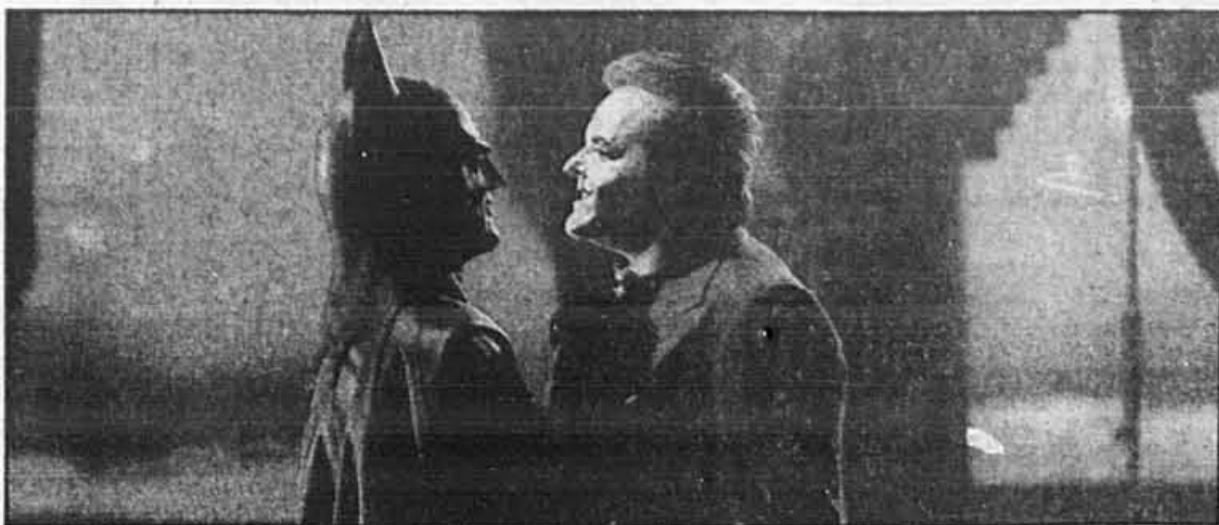
Batman et le Joker au coeur de Gotham City.

La réalité dépasse même la fiction. Une fuite dans les deux tunnels d'adduction d'eau de la ville obligerait à fermer leurs valves obligeant sans avoir la certitude