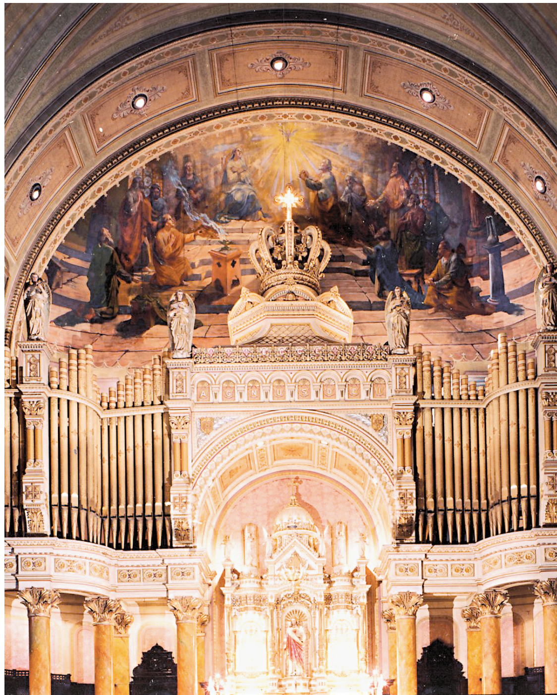
ATELIER D'HISTOIRE D'HOCHELAGA-MAISONNEUVE

Maintenant, voilà qu'on s'attaque à notre patri-