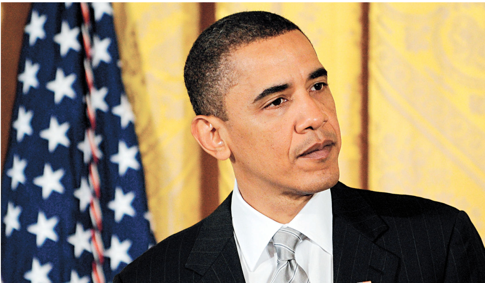
Le président américain a promis de travailler à une réduction des armes nucléaires au-delà de ce qu'exige le nouveau traité START.