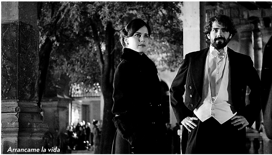
Arrancame la vida