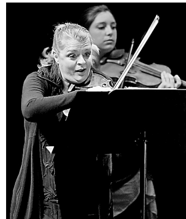
Angèle Dubeau.