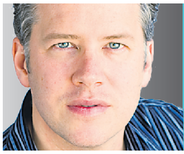
MARC CASSIVI CHRONIQUE

Son sac à dos fait la moitié de sa taille. On croirait qu'il part escalader l'Everest. C'est un peu ça. Il est entré à l'école. Mon plus vieux. À la maternelle. C'était hier sa première «vraie» journée.