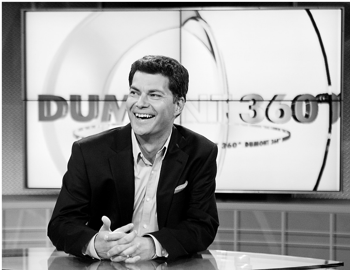
L'ancien chef de l'ADQ invitait hier les journalistes à visiter le plateau de Dumont 360 , sa nouvelle émission qui commence lundi.

Chaque émission comprendra deux courts bulletins de nouvelles. Ils seront produits par l'agence ADN5 de