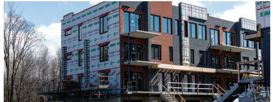
Les terrains se font de plus en plus rares.