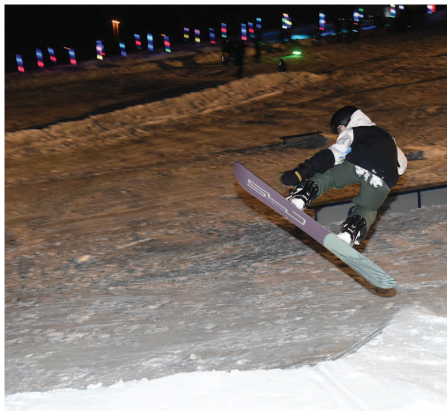
Les Julievillois sont invités à découvrir ou redécouvrir les joies des activités hivernales

Enfin, le Groupe Scouts présentera une démonstration de bivouac, et des animations ambulantes ajouteront une touche festive tout au long de la journée.