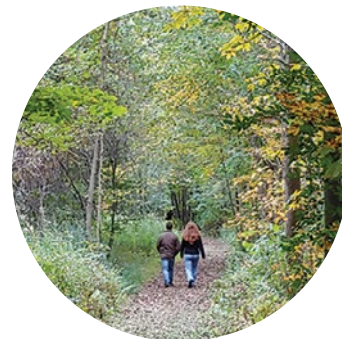
Centre écologique Fernand-Seguin