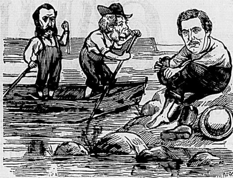
L'EMBARQUEMENT DE MERCIER.

Après cinq ou six heures de travail, nous servions sur la table de