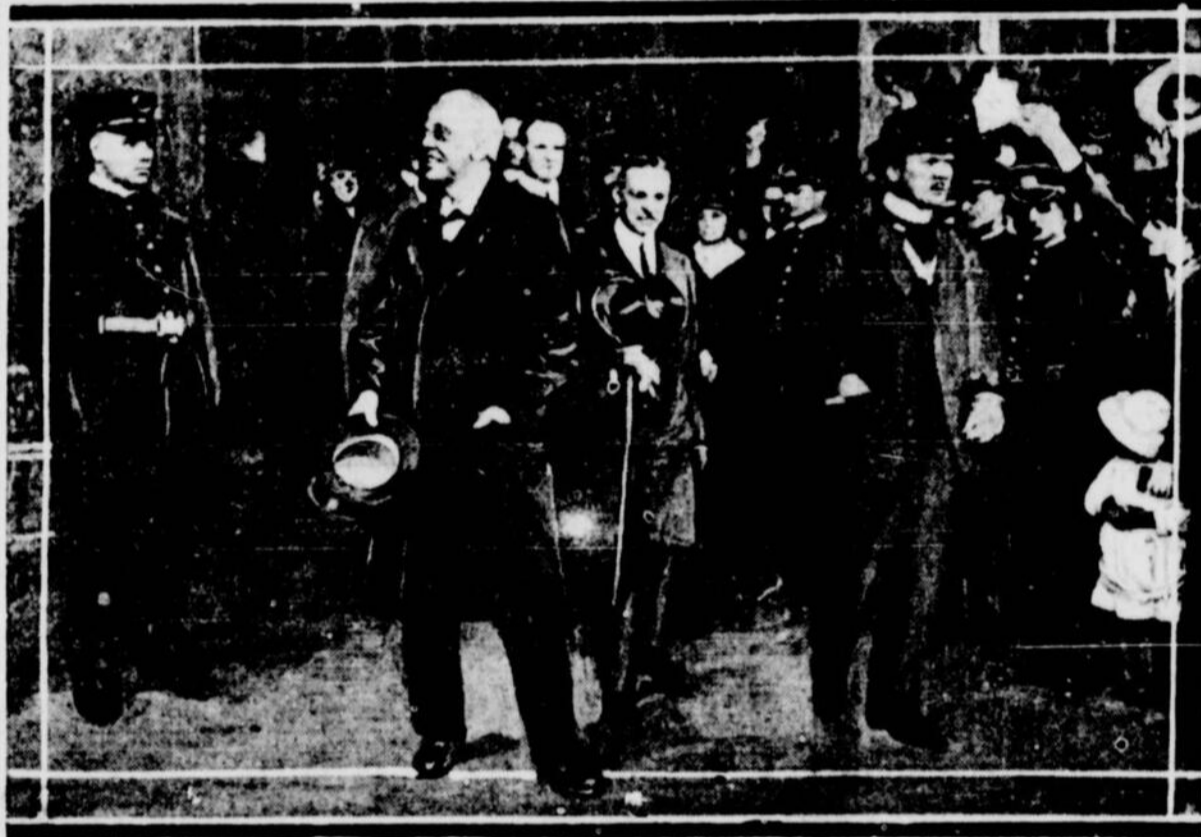
LE TRES HONORABLE A. J. BAILEY, secrétaire des Affaires étrangères de la Grande-Bretagne, répondant aux saluts de la foule, à son arrivée à la gare Bonaventure, hier.