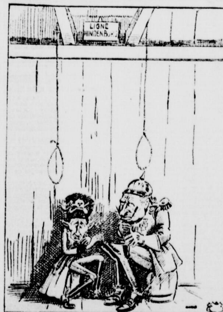
LE KRONPRINZ. — "Dites donc, papa, il y a maintenant deux lignes Hindenburg, et toutes les deux menacent de nous étrangler!"