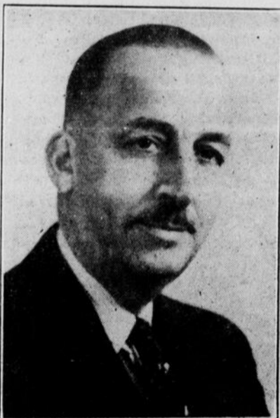
Dr A. LAURENDEAU, M. P.

"C'est avec plaisir que j'offre à tous les travailleurs du Comté mes vœux les plus sincères d'heureuse "Fête du Travail". Je me réjouis à constater la magnifique coopération de tous mes citoyens pour réussir cette démonstration. J'adresse mes félicitations à l'Ordre des Chevaliers de Colomb pour leur beau travail d'organisation".