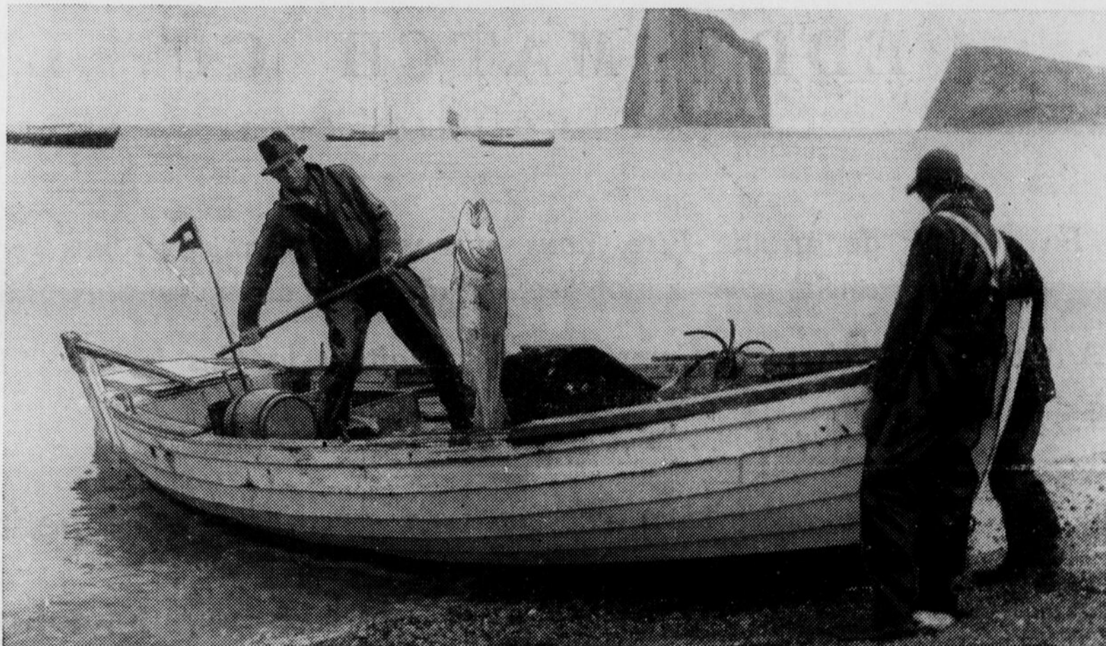
Les pêcheurs du Québec font de belles prises dans l'Atlantique