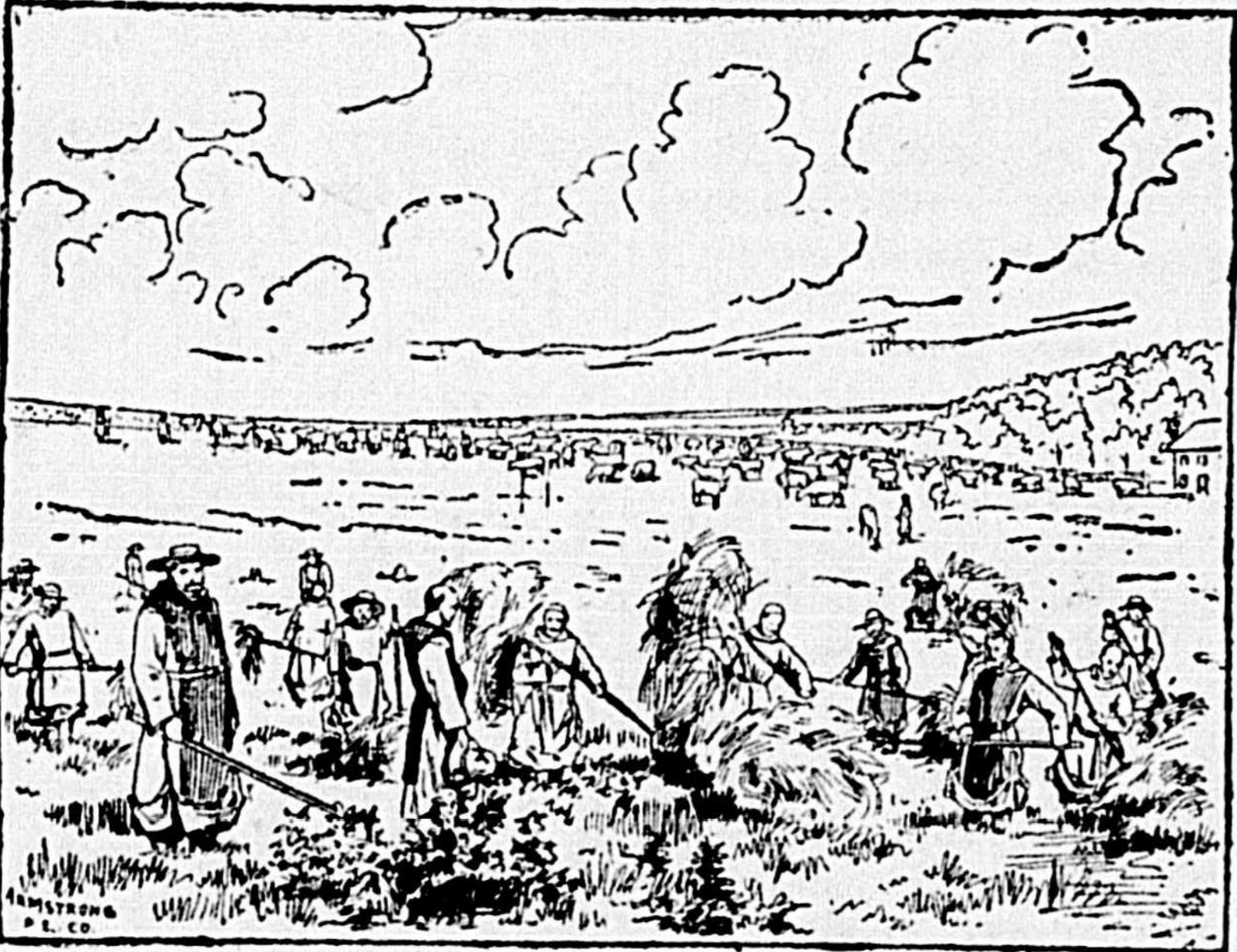
LES TRAPPISTES TRAVAILLENT AUX FOINS

Ce long travail n'aurait point de fin si nous allions y donner tout les détails, dignes de mention, de notre visite à Oka. Avant de terminer cependant, disons que nous avons été témoin d'un trait qui donne une idée de la discipline suivie à la Trappe.