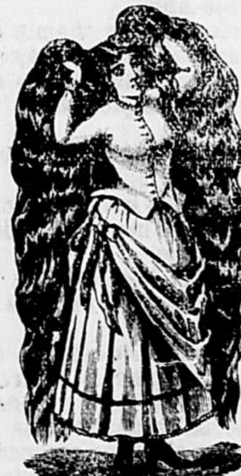
MARQUE DE COMMERCE.

Robson rend aux cheveux leur noir primitif, mais il possède de plus la précieuse propriété de les assouplir et de leur donner un lustre incomparable. Essayez ce Restaurateur, et vous serez pleinement satisfait. Prix 50 cts la bouteille. Vendu chez tous les marchands et chez L. ROBITAILLE, Pharm, Joliette.