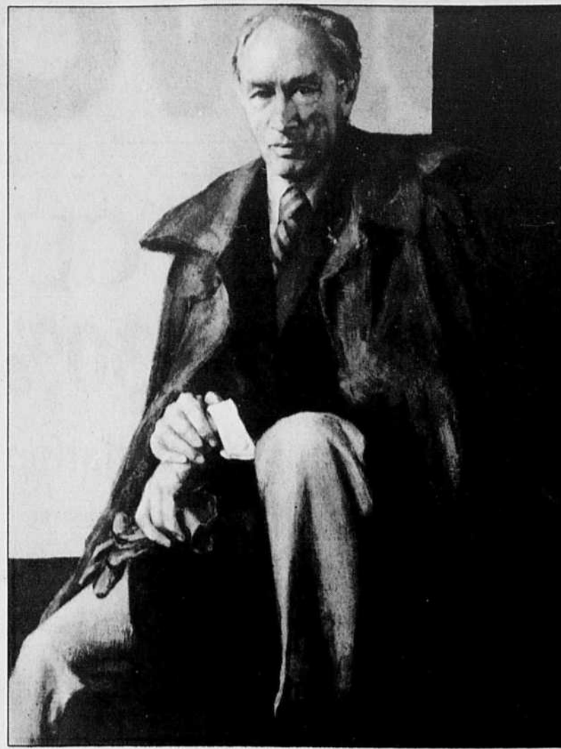
Le portrait officiel de l'ancien premier ministre sera dévoilé le 1er mai, au Parlement fédéral.

Une commission parlementaire se penchera aujourd'hui et demain sur la proposition tarifaire d'Hydro-Québec, qui demande 5,9 %; l'opposition a déjà fait savoir qu'elle réclame le gel des tarifs. Une réception officielle sera d'autre part offerte en l'honneur des athlètes québécois qui ont participé aux Jeux olympiques d'Alberville.