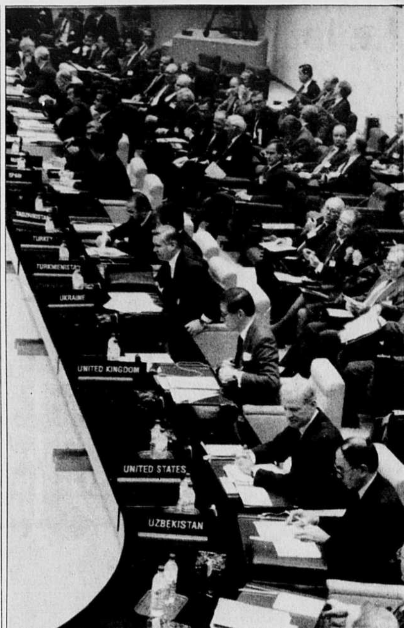
Les ministres des Affaires étrangères du Forum de l'OTAN sur la sécurité qui s'est ouvert hier à Bruxelles.

En conférence de presse, hier, M. Mulroney a laissé entendre que le Canada pourrait prochainement augmenter son aide au royaume hachémite.