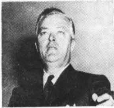
M. Jean Lesage, Premier Ministre de la Province