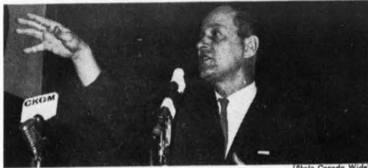
M. René Lévesque, Ministre des Ressources naturelles de la Province de Québec

Dans tous les milieux, des voix qui font autorité s'élèvent contre la dangereuse illusion, "la monumentale duperie" du Crédit social. Pensons-y-bien. L'avenir du Québec est en jeu.