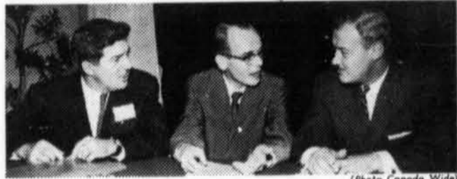
MM. Jean Marchand, président du CSN, Gérard Picard, président de la Fédération de l'Imprimerie et Roger Provost, président de la FTQ.

M. Gérard Pelletier, rédacteur en chef du quotidien La Presse, ancien directeur de l'organe ouvrier Le Travail, dans un éditorial en date du 22 août 1962 intitulé: Caouette et le syndicalisme.