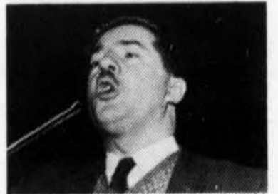
Jean Marchand, président du CSN

"(...) Un parti politique qui se prononce ouvertement contre l'idée même de la planification économique, sous prétexte de sauvegarder la liberté, ne songe qu'à la liberté des grands employeurs et des grands financiers et cette liberté est la négation même, dans l'état actuel des choses, des droits des petits et des humbles à un salaire convenable, à la sécurité de l'emploi, à la santé, etc. (...)"