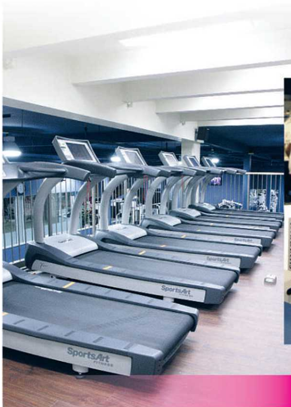
Planète Fitness Gym 24h offre à ses clients des appareils tout neufs, ultra modernes et hyper performants qui les aideront à atteindre leurs objectifs santé.

Peu importe vers quelle section vous vous dirigerez, votre entraînement deviendra une vraie source de plaisir et de détente! D'autant plus que vous serez guidés par l'un des quatre entraîneurs privés expérimentés disponibles au centre. Tous sont habilités à répondre à vos besoins personnels spécifiques.