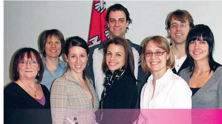
Membres de l'Unité d'Investigation clinique de l'INAF

À l'Université Laval, l'INAF rassemble des équipes multidisciplinaires de chercheurs, nutritionnistes, infirmières, psychologues et cuisiniers qui coopèrent dans le but d'offrir aux participants un environnement favorisant la motivation et la réussite des projets de recherche. Un volet intéressant est sans aucun doute les ressources nutritionnelles et psychologiques offertes pour l'analyse du comportement alimentaire, en lien avec l'obésité et la gestion du poids. L'INAF vient par ailleurs de se voir octroyer 6,7 millions