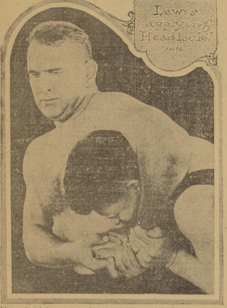
L'on voit ici le nouveau champion du monde à la lutte, Ed. Strangler Lewis, démontrant sa fameuse prise de tête. C'est à l'aide de cette prise que Lewis parvint à battre Joe Stecher.