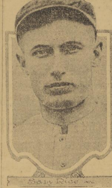
SAM RICE, joueur de champ du club Washington, de la ligue Américaine qui, sur 478 chances, a obtenu 454 "put-outs" en 24 ans, pour un pourcentage de 960. C'est un record pour les ligues majeures.

Tijuana, 30 — Le sport des courses continue toujours à être très patronisé ici. L'assistance se fait toujours de plus en plus nombreuse. Les écuries de Irwin et de Walker sont encore à la tête des heureux gagnants durant la présente réunion.