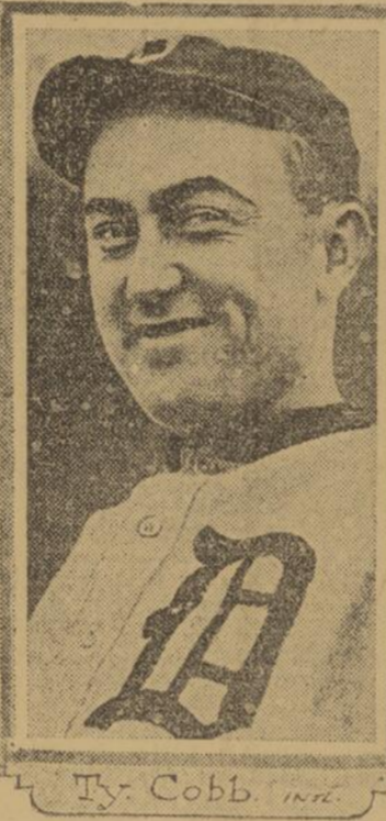
TY COBB, qui vient d'être nommé gérant des Tigers de la Ligue Américaine.