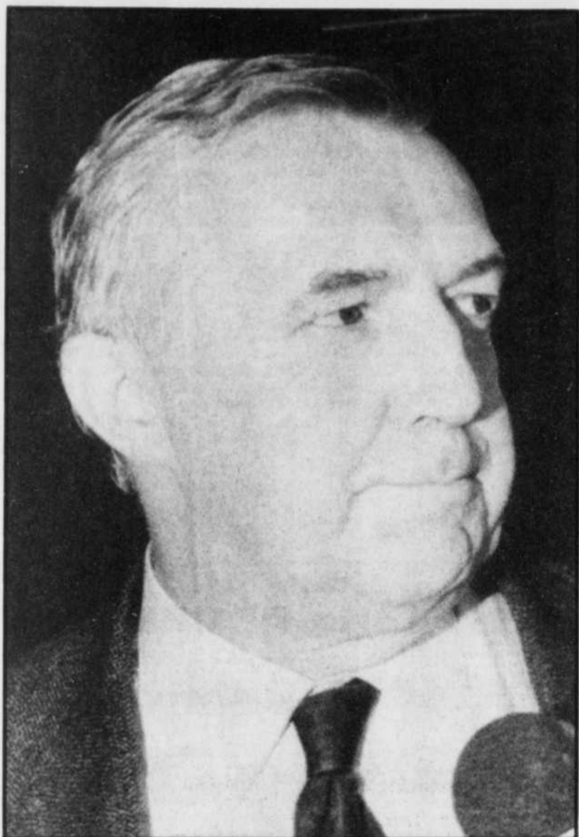
"Comme leader du parti, a déclaré Richard Hatfield en apprenant la défaite des conservateurs, j'accepte la pleine responsabilité." Et il s'agit de toute une défaite puisque les libéraux ont raflé la totalité des 58 sièges au Nouveau-Brunswick.

• Les libéraux raflent les 58 sièges et mettent un terme à 17 ans de règne conservateur au Nouveau-Brunswick