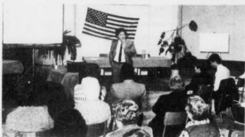
Même s'il n'avait pas été invité, le député de Sherbrooke aux Communes et ministre d'État à la Jeunesse, Jean Charest, est intervenu à quelques reprises au colloque sur le libre-échange tenu hier, à l'initiative du Service de pastorale sociale du diocèse de Sherbrooke.

Tous ces gens ont promis de poursuivre le débat dans leur groupe respectif et de harceler les politiciens afin d'obtenir toutes les informations désirées.