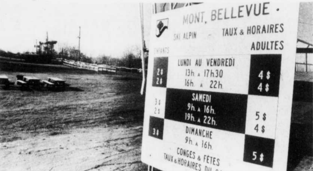
Les tarifs généraux seront haussés dès l'ouverture de la saison de ski alpin.

A tout événement, voyant sans doute que ses conseillers s'embarquaient sur un terrain glis-