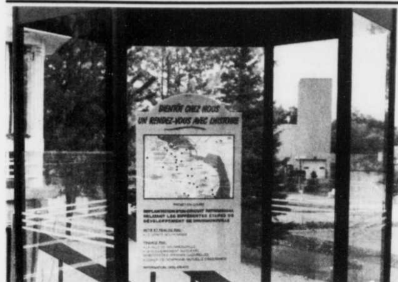
D'ici juin 1989, Drummondville sera dotée d'un circuit patrimonial, comme on peut le constater par cette affiche installée dans un abribus au parc Ste-Thérèse.