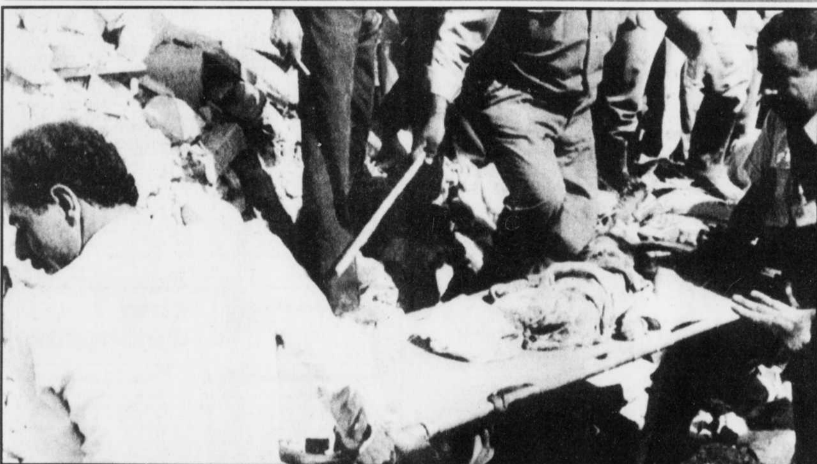
Des secouristes transportent le corps d'un petit enfant à Bagdad, en Irak. Un missile sol-sol iranien est tombé à 07h55 locales à côté d'une école, à l'heure où les enfants se mettaient en rang

Quant au Nouveau Parti démocratique, il a présenté un candidat dans chacune des 58 circonscriptions pour la première fois de son histoire. Mais, sans se faire d'illusions, il a concentré ses efforts dans une demi-douzaine de comtés, où il croyait avoir quelques chances.