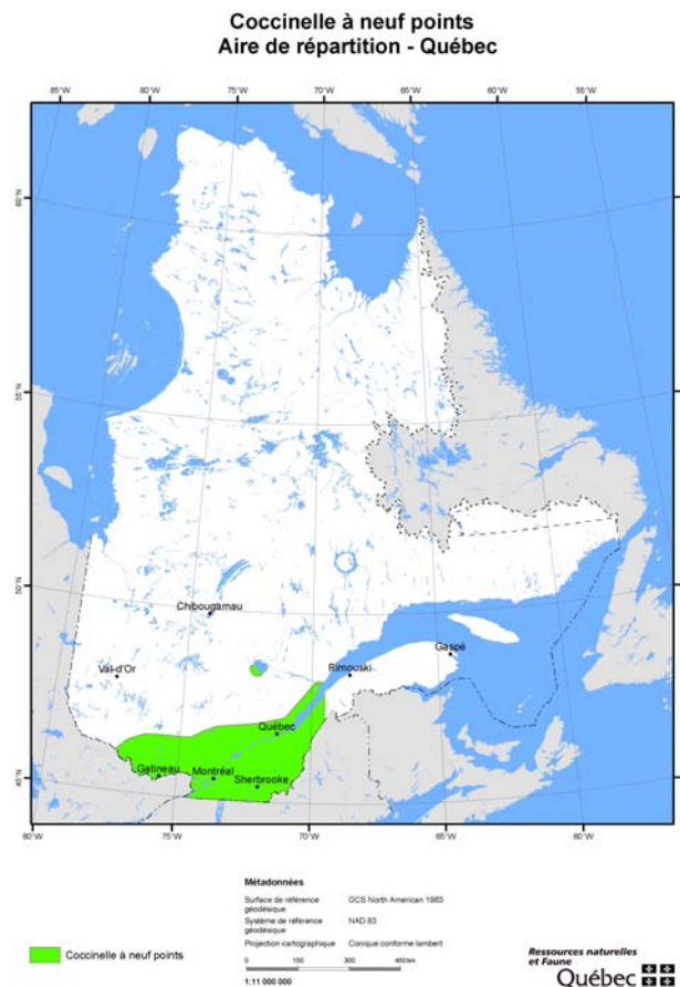
Figure 2. Aire de répartition de la coccinelle à neuf points au Québec

La répartition de la coccinelle à neuf points, illustrée à la figure 2, a été établie à partir des données tirées des collections visitées lors du présent travail. Elle constitue une carte de répartition historique de l'espèce puisque la dernière mention ayant servi à son élaboration date de 1980. Il est important de mentionner que l'absence de données sur l'espèce à l'extérieur de cette aire ne veut pas dire que l'espèce n'y est jamais rencontrée. Il demeure possible que des données de coccinelle à neuf points soient présentes dans des collections privées non visitées lors de ce travail. Les sites de localisation exacts sont toutes présentés à l'annexe 3. De 2006 à 2010, Michel Racine a observé la coccinelle à neuf points dans une sablière abandonnée située au mont Saint-Hilaire (M. Racine, comm. pers).