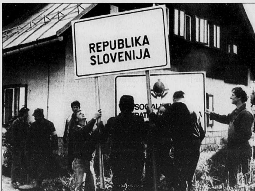
Des miliciens slovènes installent un panneau indiquant le début du territoire de la République de Slovénie à un poste-frontière après le départ pacifique des forces armées yougoslaves, le 29 juin 1991.

Je respecterai la décision prise par la majorité des Québécois au cours du prochain référendum. S'ils décident de former un État indépendant, je serai un fier citoyen de cet État, comme je suis aujourd'hui un fier citoyen du Canada. Ni la Constitution canadienne, ni les décisions prises par les Cours supérieures du Canada ne devraient intervenir avec la volonté des Québécois. Car, comme le disait Abraham Lincoln, «tout pouvoir dérive du peuple».