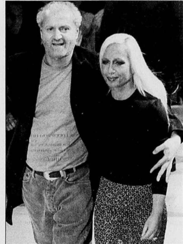
Gianni Versace et sa sœur Donatella photographiés à l'issue de la présentation de la collection Versace pour hommes, à Milan, le 12 janvier dernier.