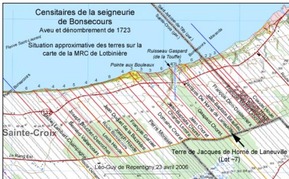
Carte : Léo-Guy de Repentigny Les familles Dehornay de Laneville