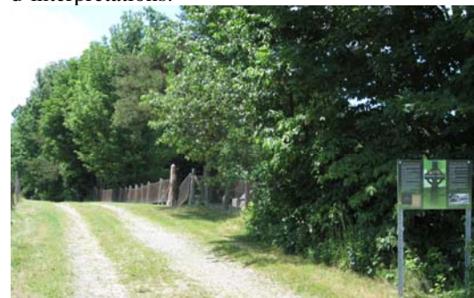
Photo de l'ancien chemin Craig prise de l'entrée est. À droite du chemin, on voit la clôture donnant au cimetière St-Georges (King's cemetery)

Finalement et non le moindre, la très grande collaboration Corneal Cealteach pour la mise en valeur de la partie du chemin Craig par l'implantation des panneaux d'interprétations.