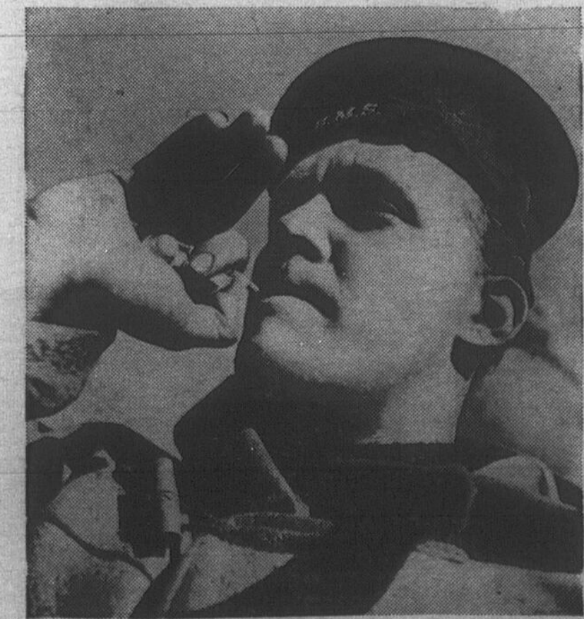
Le travail obscur mais héroïque des équipages des dragueurs de mines britanniques est d'une importance vitale à la sécurité des ports et des voies maritimes. Sur cette photo, un officier-marinier à bord d'un dragueur de mines attire l'attention de ses hommes à l'aide d'un traditionnel sifflet.