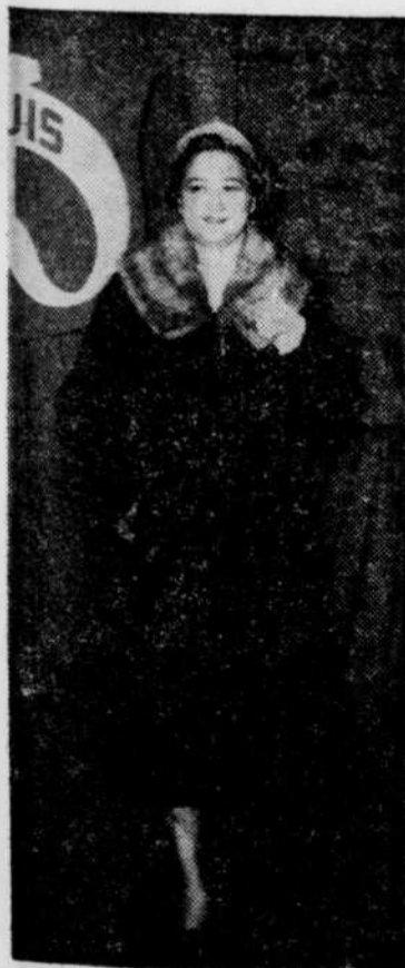
MISS L'EST MONTREALAIS