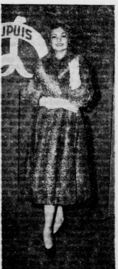
MISS EST CENTRAL