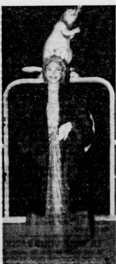
MISS RADIO-CINEMA-TV '54