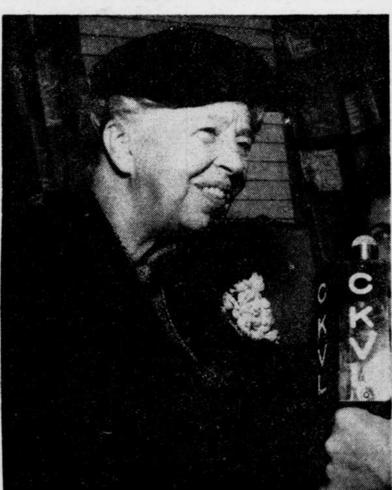
De passage à Montréal jeudi dernier Mme Eleanor Roosevelt, femme de l'ex-président des Etats-Unis. Pendant qu'elle dînait chez Ruby Foo's elle fut interviewée par une reporter de CKVL.