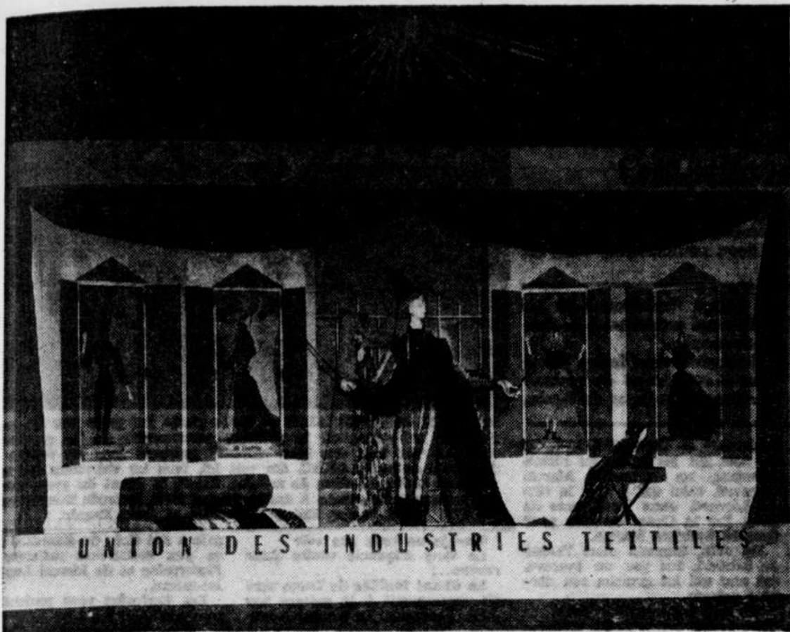
Un des plus beaux kiosques à l'exposition de la "France à Montréal" c'est celui de l'industrie des textiles.