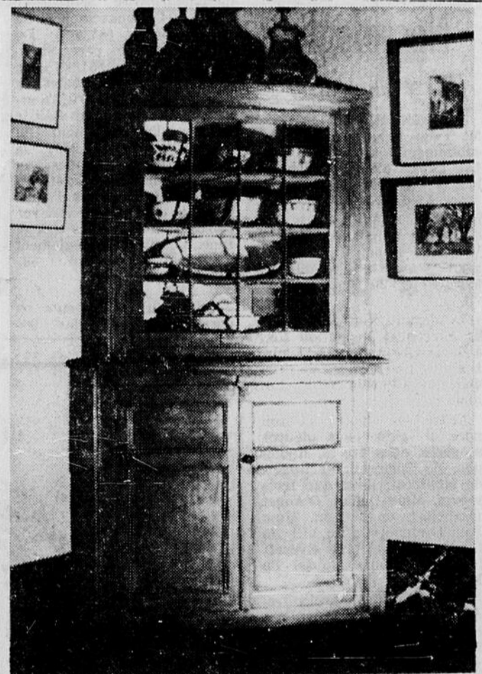
L'ARMOIRE D'ANGLE, bombée à deux étages, en bois de noyer noir décapé, comme celle-ci, est l'un des meubles les plus en demande par ceux qui collectionnent des pièces antiques. Celle-ci, acquise d'une collection particulière, date de l'école canadienne d'ébénisterie de 1830. Elle est en montre au Musée de la province de Québec, à Québec.