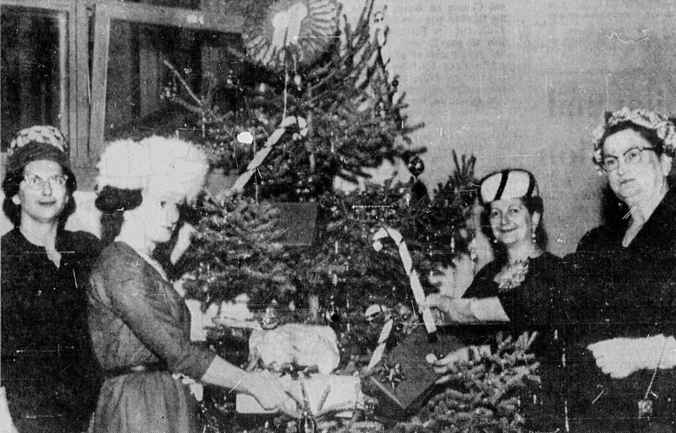
THE DE NOEL DE LA FFCF DE VAL-CARON — Le thé de Noël, organisé par la Fédération des femmes canadiennes-françaises (FFCF) de Val-Caron, dimanche dernier, a remporté un éclatant succès. En l'occurrence, la salle de l'église Notre-Dame-de-l'Espérance a reçu un grand nombre d'invités.

MERCREDI, 6 DECEMBRE 1961 EDITION DU NORD 3