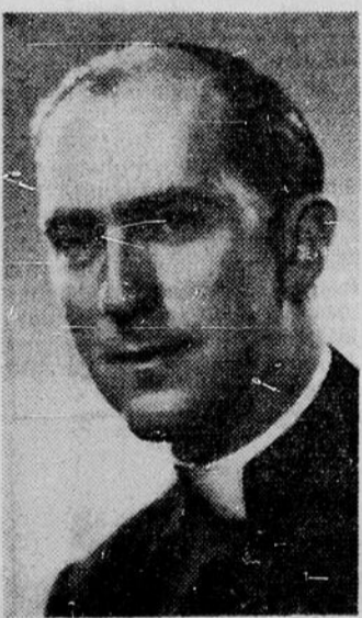
Mgr G. E. CARTER