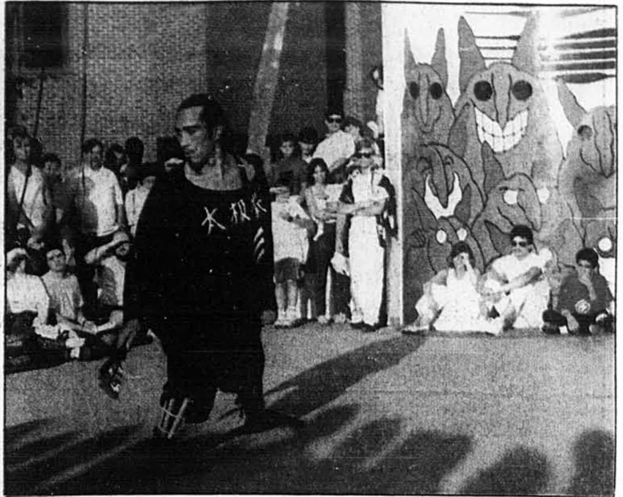
L'animation dans la rue Saint-Denis attire chaque soir une foule de spectateurs

Les escales sont bien choisies. L'université McGill, le Mont-Royal, la Place d'Armes pour n'en nommer que quelques unes. Les montres des acteurs, des figurants, des techniciens et des coordinateurs ont sans doute été synchronisées, parce que leur «timing» est impeccable, leur rythme sans reproches. Vendredi après-midi, les spectateurs en étaient ravis pour la plupart.