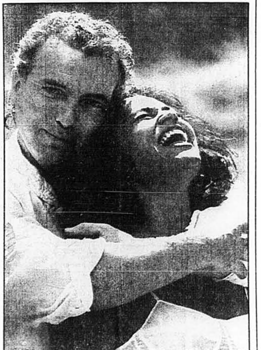
Le chanteur français Bernard Lavilliers et la chanteuse belge Viktor Lazlo se sont retrouvés au Festival d'été de Québec.