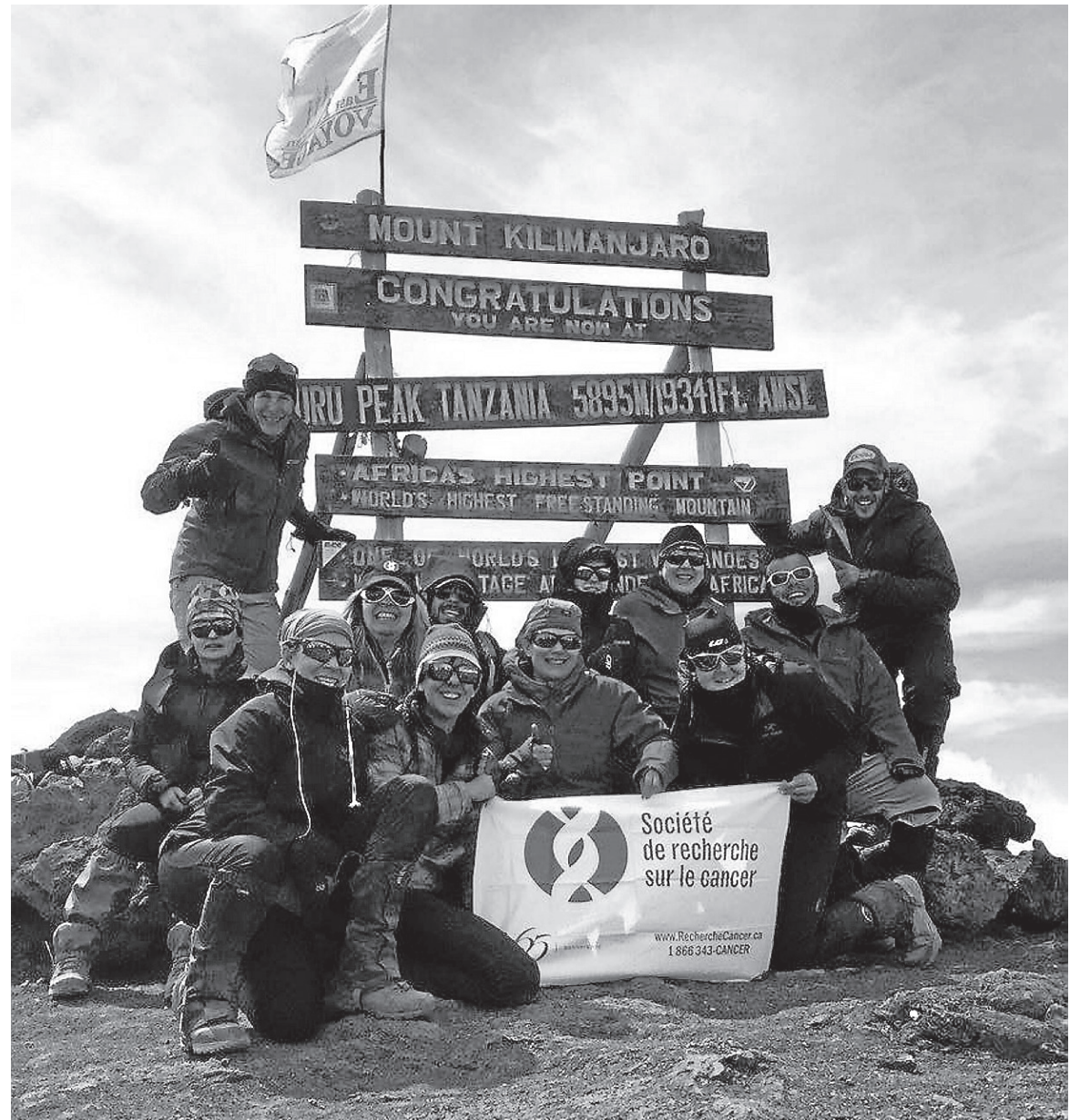
En compagnie de 12 autres participants, le Granbyen a atteint le sommet du Kilimandjaro en octobre. Grâce à ses différentes collectes de dons, il a remis plus de 13 000 $ à la fondation.