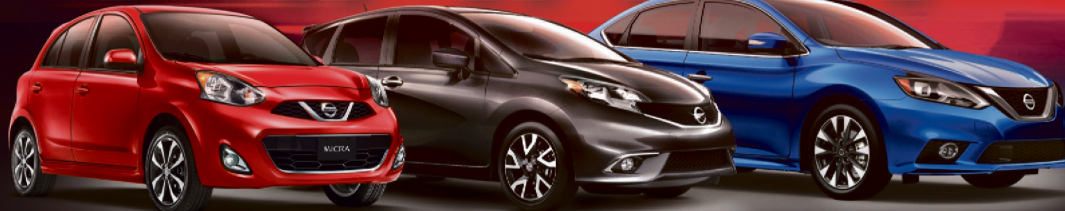
Micra SR illustrée *