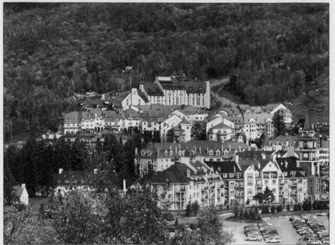
L'hôtel et le complexe d'hébergement actuel d'Intrawest à Mont-Tremblant.

La population locale a augmenté de 30 % en cinq ans