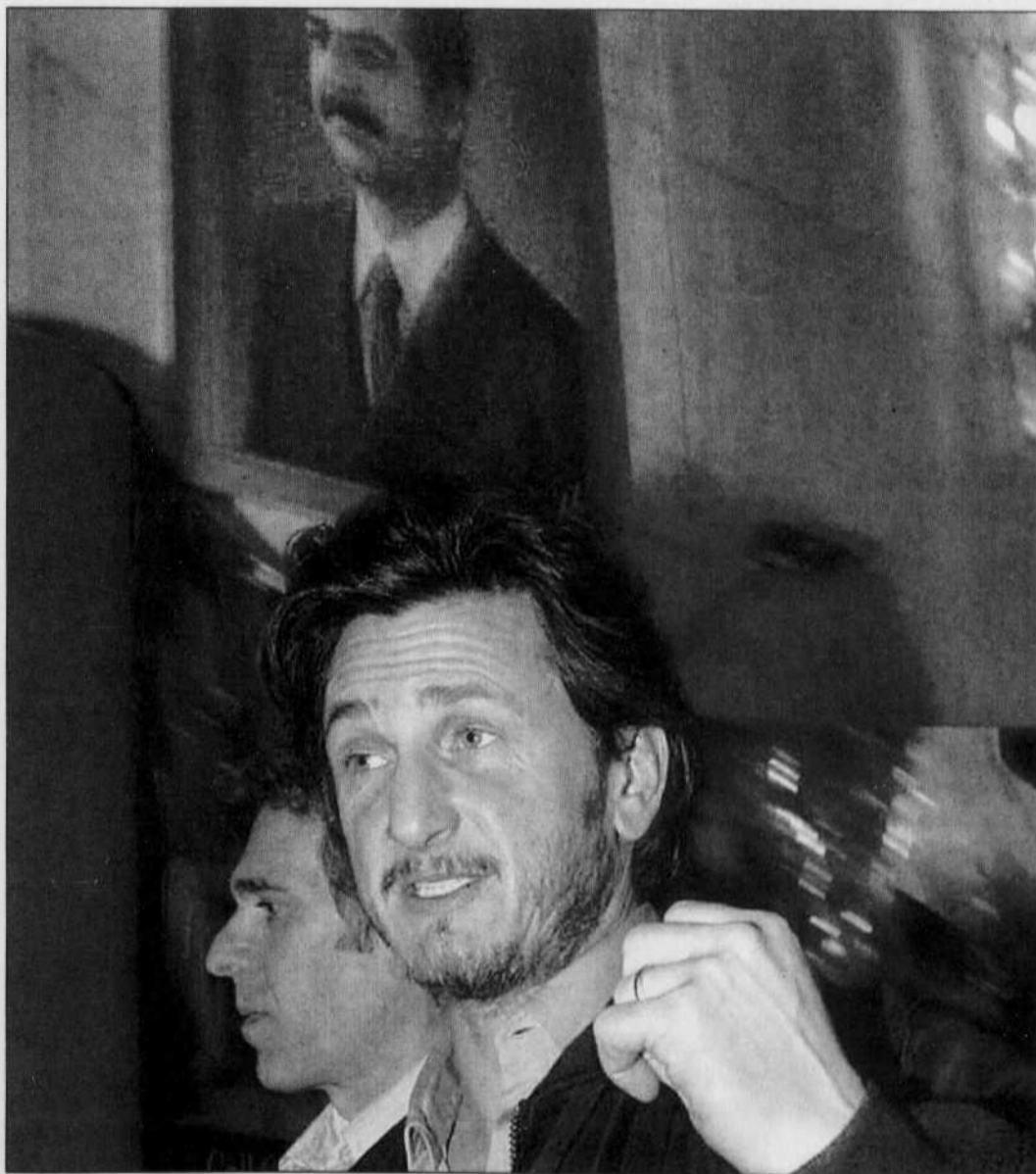
L'acteur et réalisateur Sean Penn a osé clamer haut et fort que la guerre pouvait être évitée.

Où sont les artistes? Ceux à qui les jeunes ont tellement donné. Et qui n'ont pas seulement le devoir de nous divertir mais aussi d'accompagner la société dans ce qu'elle a de plus heureux ou de plus sombre.