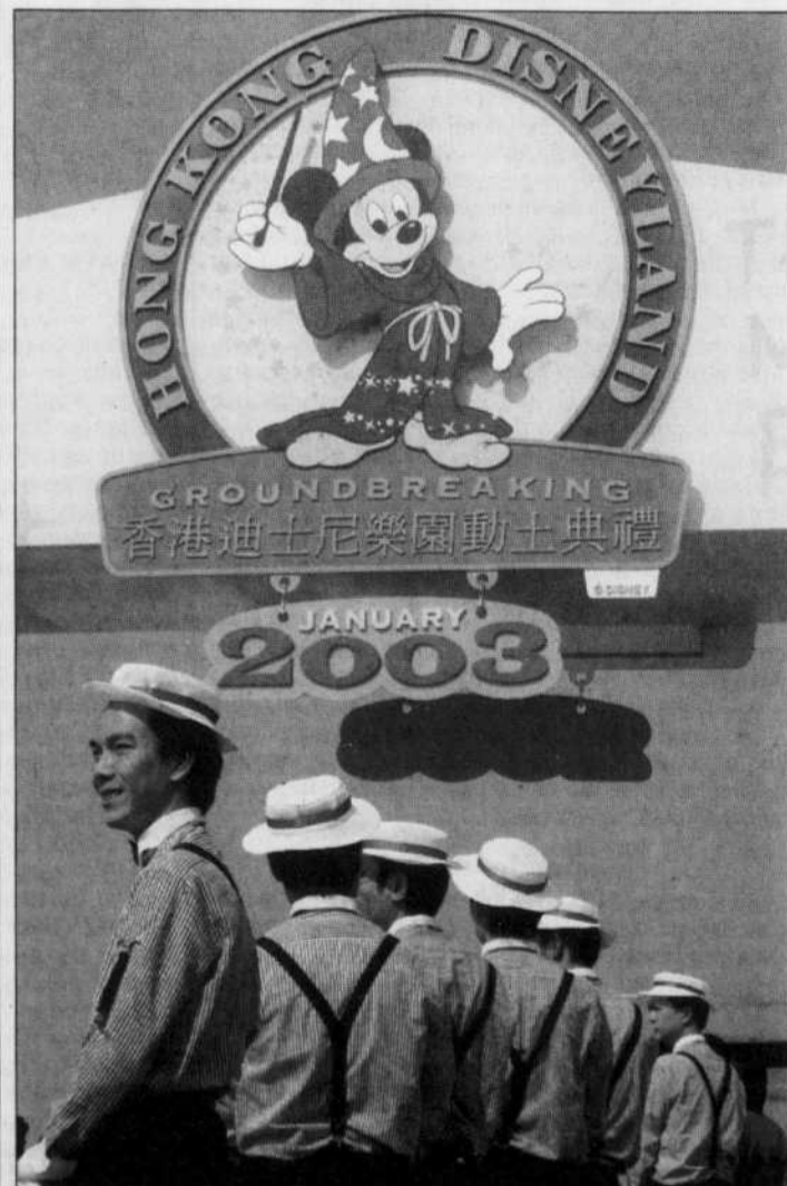
LE DÉBUT des travaux de construction du premier parc thématique Disney en Chine a été souligné en grande pompe hier à Hong Kong. Le Disneyland chinois devrait ouvrir ses portes au cours des premiers mois de 2006.