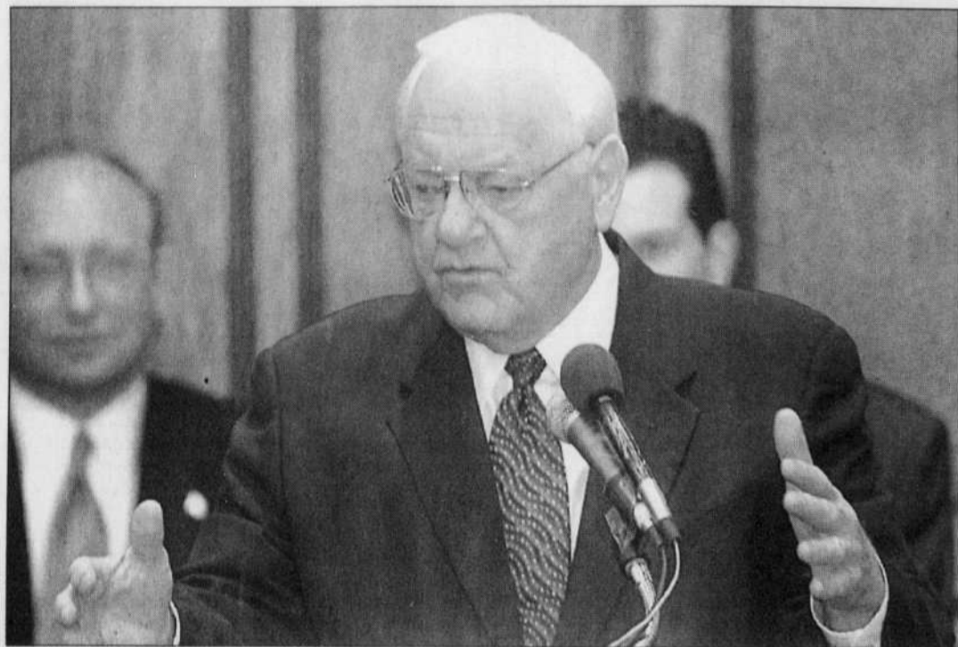
George Ryan, le gouverneur républicain sortant de l'Illinois, a justifié samedi sa décision de commuer toutes les condamnations à mort de son État en peines de réclusion à perpétuité par «le démon de l'erreur».

tour dans les couloirs de la mort. L'Iran, l'Arabie saoudite, Taïwan, l'Afghanistan, la Sierra Leone ou le Rwanda ont également exécuté plusieurs dizaines de personnes ces dernières années.