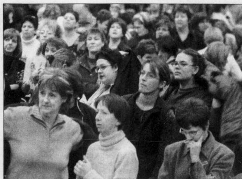
Quelque 1200 employés de la Banque Laurentienne, réunis hier en assemblée générale, ont voté en faveur d'une grève générale

La Banque Laurentienne exige plusieurs concessions du syndicat, notamment au chapitre de la flexibilité des horaires et des statuts d'emploi. Il est entre autres question d'accroître le recours aux employés temporaires et à temps partiel. L'employeur voudrait