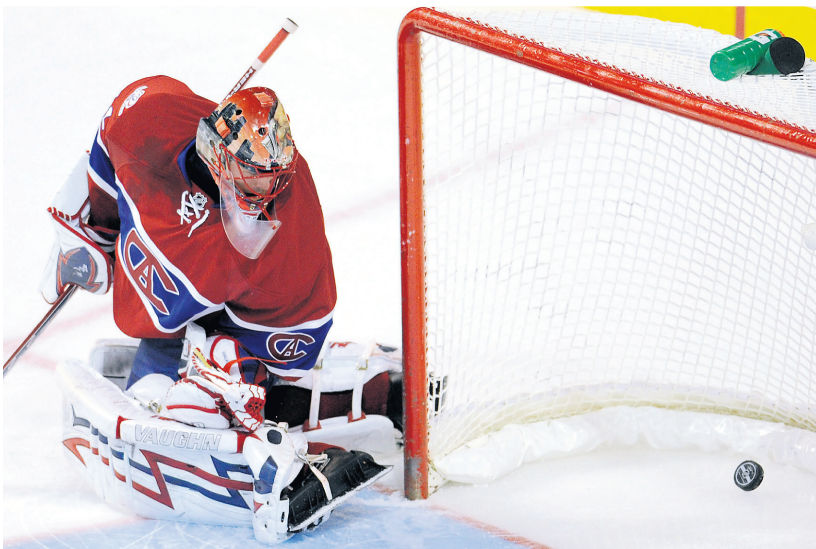
Jaroslav Halak et ses coéquipiers ont laissé les Maple Leafs prendre les devants 4-0 pour finalement encaisser une cinquième défaite de suite.