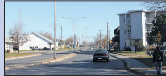
Le boulevard Dollard fera l'objet d'importants travaux de réfection cette année qui se termineront en 2013.

La pièce maîtresse du PTI demeure sans contredit la réfection des infrastructures du boulevard Dollard, projet pour lequel une somme de 7,5 M$ a été prévue cette année (d'autres travaux estimés à 2 M$ seront réalisés en 2013). Le projet prendra forme entre la rue Saint-Thomas et le viaduc de l'autoroute 31 actuellement en reconstruction par le ministère des Transports du Québec. Il s'agira de mettre en place un nouveau réseau d'aqueduc, d'égouts sanitaire et pluvial et de remplacer les trottoirs, les bordures ainsi que la chaussée. De nouveaux lampadaires seront installés; le terre-plein sera paysagé grâce à la plantation d'arbres, d'arbustes et de fleurs. Le résultat ressemblera à ce qui a été réalisé sur les boulevards Sainte-Anne et Manseau, de sorte que l'entrée sud de la ville sera nettement plus accueillante.