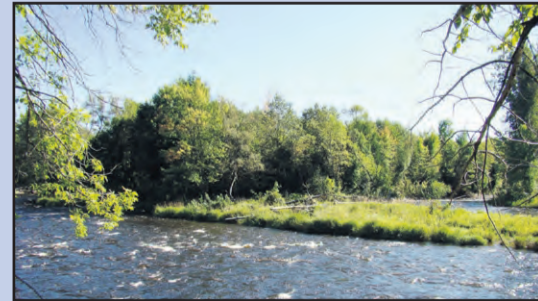
L'île Vessot, un autre joyau naturel de la ville de Joliette dont la population profitera bientôt.

Le programme de renouvellement et d'amélioration du matériel roulant se poursuivra cette année avec une enveloppe budgétaire de près de 1,3 M$. Ce montant comprend notamment l'acquisition d'un poste de commandement pour le service des Incendies.