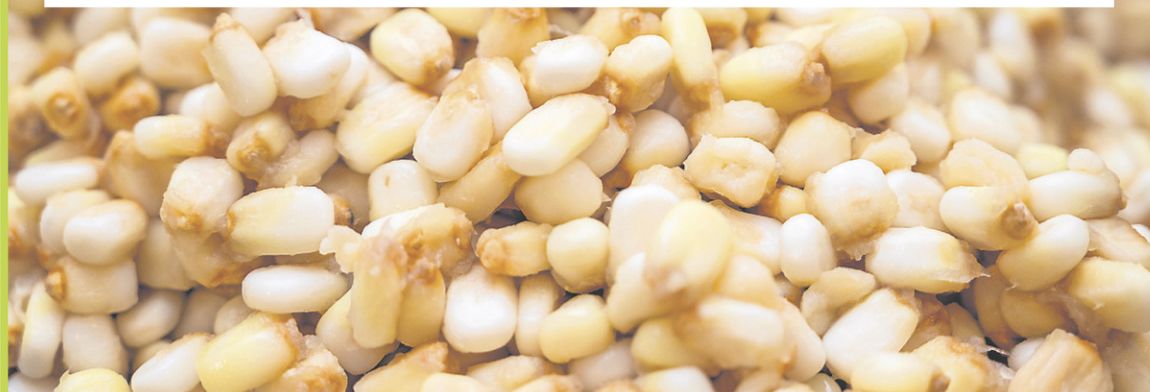
Lors du procédé de nixtamalisation, le maïs blanc prend une teinte d'or pâle.