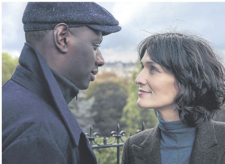
Omar Sy et Clotilde Hesme dans la deuxième saison de Lupin

On s'était donc laissé alors qu'Assane Diop (Omar Sy) et son ex, Claire (Ludivine Sagnier), avaient perdu la trace de leur fils Raoul (Étan Simon), qui a vraisemblablement été enlevé. La panique, et une cruelle façon de