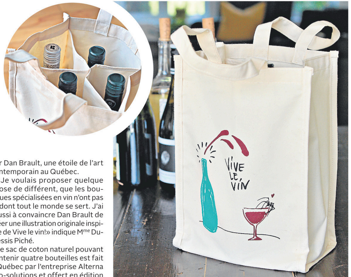
Le sac de coton naturel illustré par Dan Brault peut contenir quatre bouteilles.

La journaliste et chroniqueuse spécialisée en vin Karyne Duplessis Piché lance un sac de transport pour les bouteilles de vin illustré