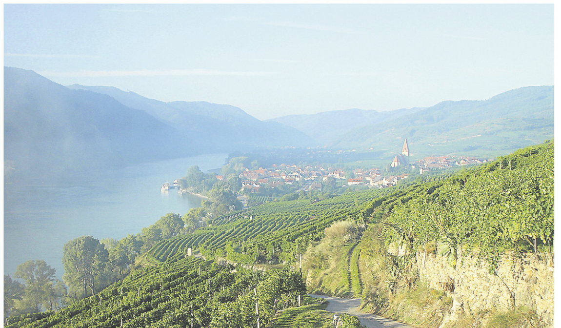
La région vinicole de la Wachau est classée au patrimoine mondial de l'UNESCO.

Pour en savoir davantage, suivez-moi sur www.sommeliereaventuriere.com