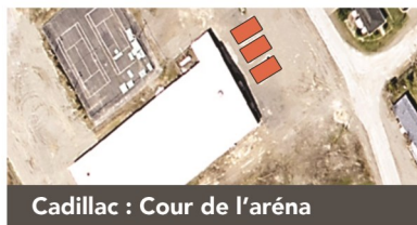
Cadillac : Cour de l'aréna