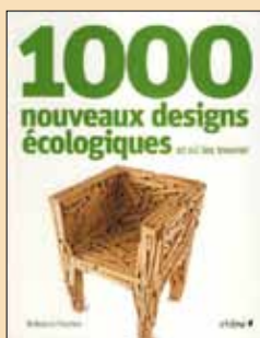
1000 nouveaux designs écologiques