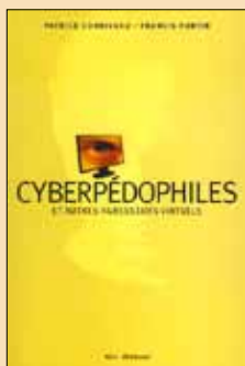
Cyberpédophiles et autres agresseurs virtuels