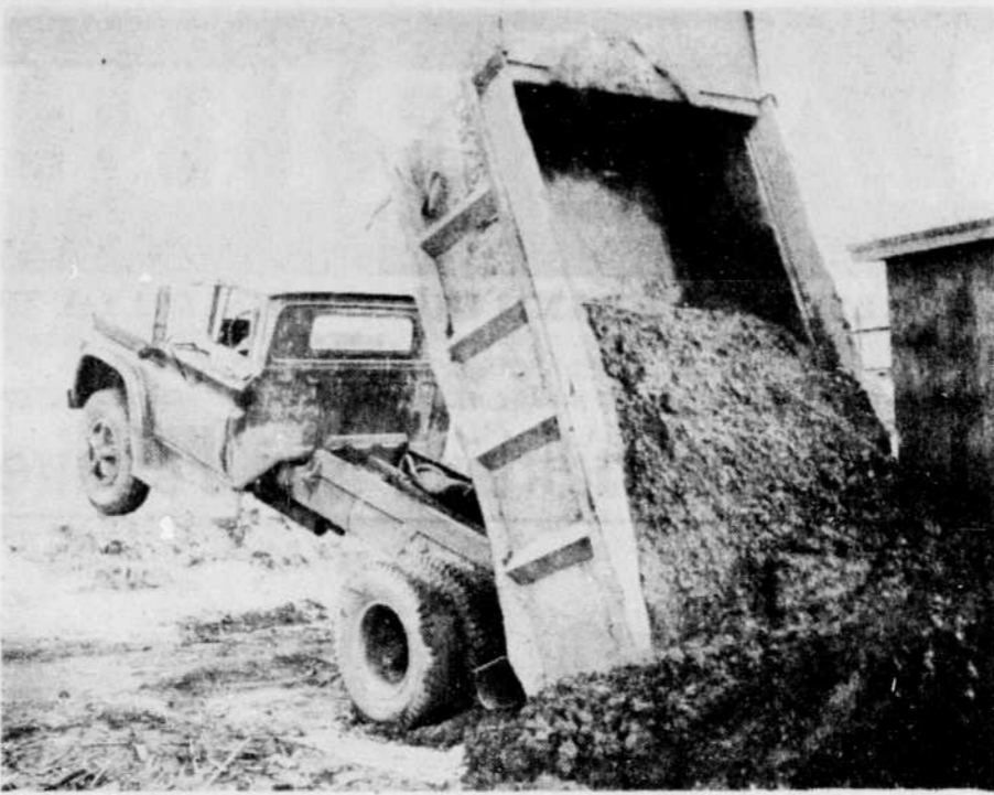
FACHEUSE POSITION. — Un camion qui était affecté au transport de terre pour niveler la partie qui servira de stationnement au nouveau centre d'achats Plaza Granby, s'est retrouvé dans une position plutôt précaire hier après-midi. La porte à l'arrière de la bascule n'a pas opéré et la terre a retenu le camion en se déversant. Il a fallu plus tard utiliser un tracteur muni d'une pelle pour dégager la terre qui plaçait l'avant du véhicule à environ six pieds de terre.