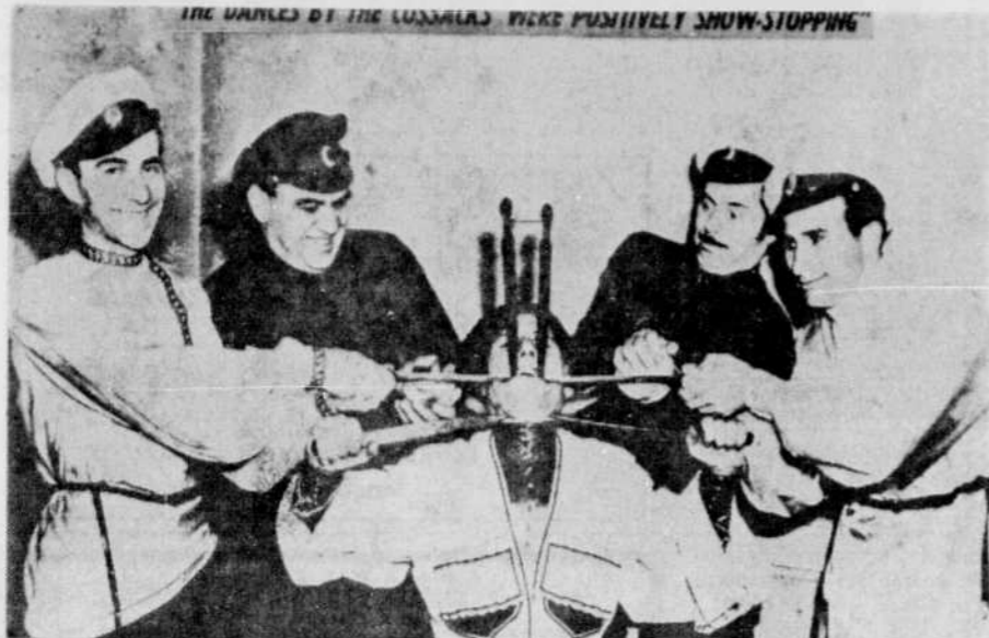
A THETFORD MINES DIMANCHE — Sous les auspices des Chevaliers de Colomb, un spectacle sera présenté au Centre des loisirs de Thetford Mines dimanche soir prochain à 8 heures, par les chanteurs et danseurs de célèbres Cosques du Don, du général Platorff, sous la direction musicale de N. Kostroff. La photo ci-haut illustre une des nombreuses scènes que le public de la région de l'amiante aura la satisfaction de voir et d'applaudir en fin de semaine.