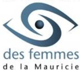
Table de concertation du mouvement