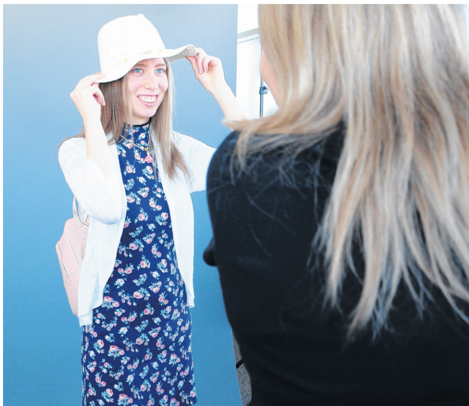
Les sourires sur les visages en disaient long.

Une partie des sous cumulés avec la vente de la revue seront remis à la Fondation Véro et Louis. L'autre permettra de bonifier des activités qui seront offertes aux jeunes. L'organisme amasse des fonds pour construire une maison pour les autistes âgés de 21 ans et plus. «Si nous voulons qu'ils soient des citoyens à part entière, il faut les mettre dans des milieux où ils vont se réaliser.» Le reste de la somme ira aux enfants.