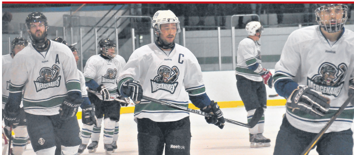
Les Mercenaires ont baissé l'échine devant les premiers de la saison régulière, le Danplex de Saint-Éphrem.