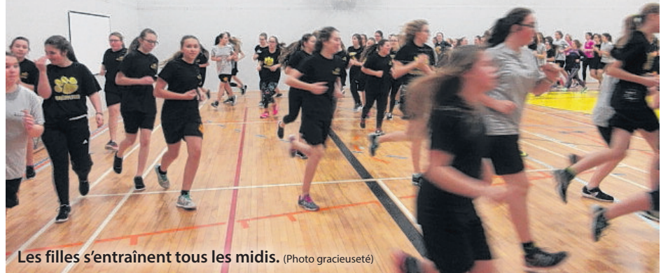
Les filles s'entraînent tous les midis.

L'évènement aura lieu à la Base de plein air de Sainte-Foy.