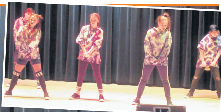
La troupe de danse KIDZ ira à Beauceville pour la finale régionale de Secondaire en spectacle.

Ces finalistes se rendront à la finale régionale à Beauceville le 13 avril. La grande finale aura lieu à Sorel-Tracy du 2 au 4 juin.