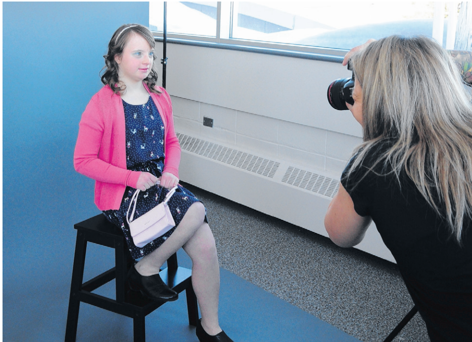
Les jeunes du programme Formation préparatoire au travail adapté sont atteints de différents troubles et déficits comme l'autisme ou la trisomie 21.

MÉLANIE LABRECQUE melanie.labrecque@tc.tc