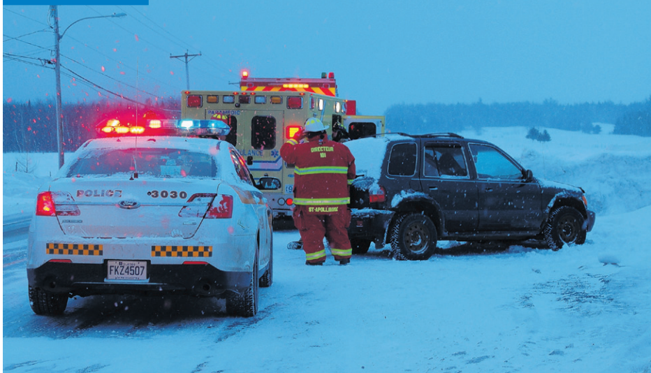
La route peut demeurer glissante par endroit.