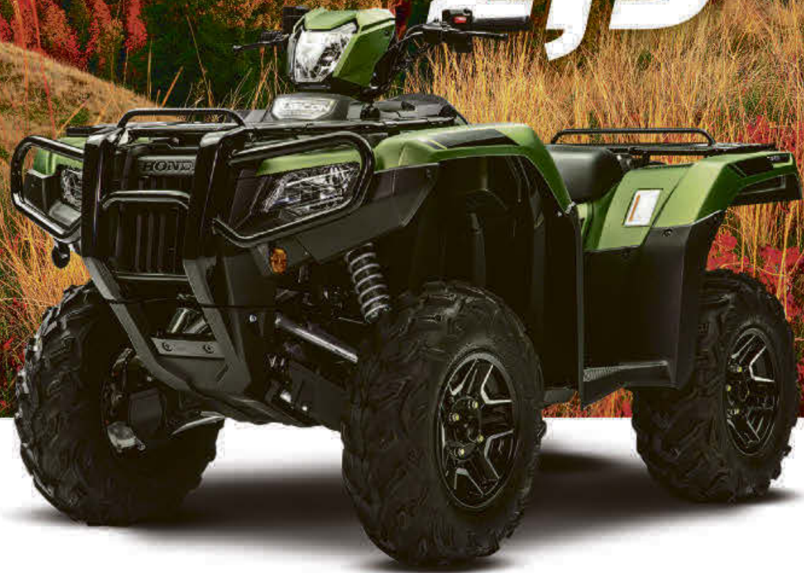
TRX520 Rubicon DCT Deluxe 2020