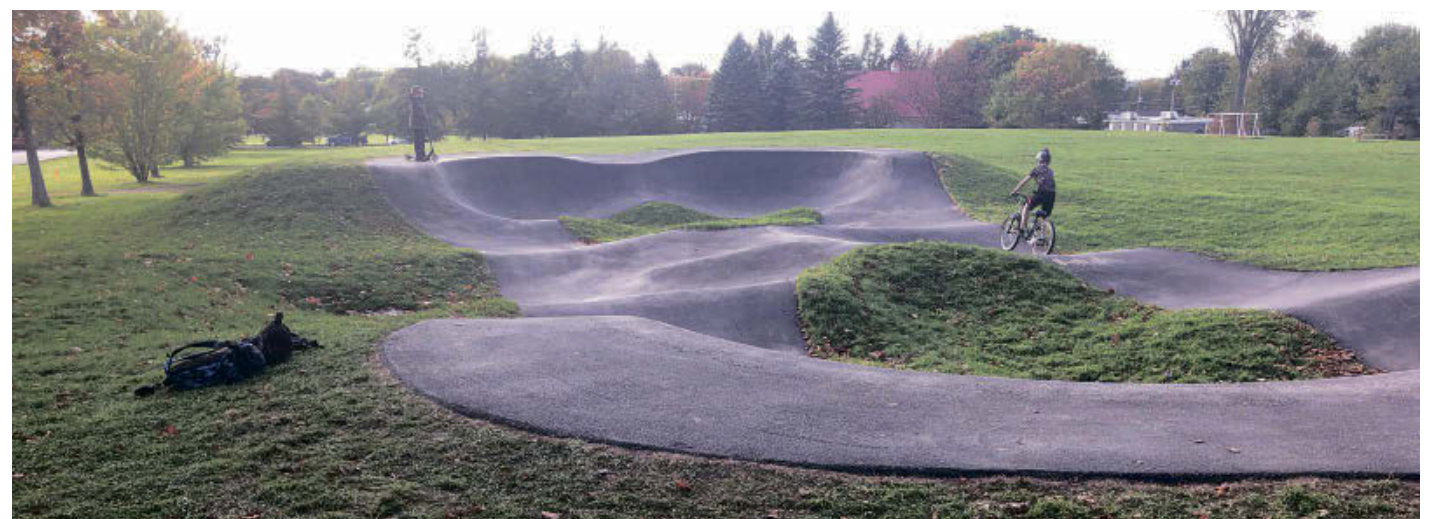
La Ville de Valcourt vient d'inaugurer sa nouvelle piste « Pumptrack », située sur la rue Champêtre.

« L'intérêt pour la pratique du vélo, de la trottinette, de la planche à roulette et du patin à roues alignées sur piste multiusages est de plus en plus marqué