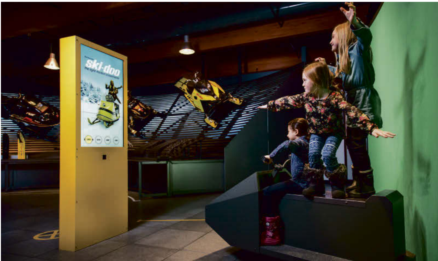
Le Musée de l'ingéniosité J.Armand Bombardier vient d'obtenir une aide financière de 400 000 $ de Québec pour défrayer ses frais de fonctionnement et poursuivre sa mission avec encore plus d'efficacité.